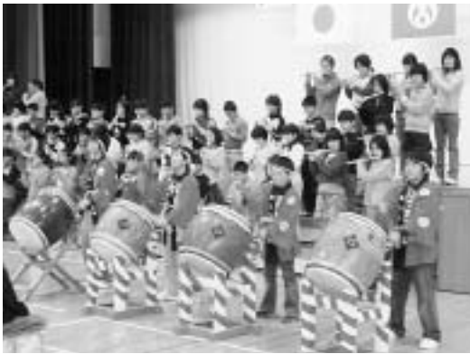
入学式で演奏される葛西ばやし

さらに、商業の発展のために市を開き、祭りには鐘や太鼓を鳴らして盛り上げたといわれています。このおはやしが地域の方々