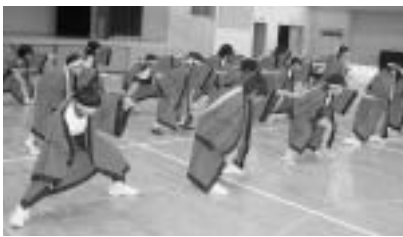
華麗に豪快に舞うYOSAKOIソーラン