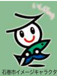
石巻市イメージキャラクター