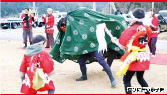
喜びに舞う獅子舞