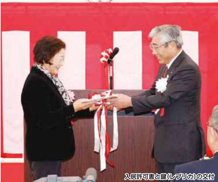
入居許可書と鍵(レプリカ)の交付