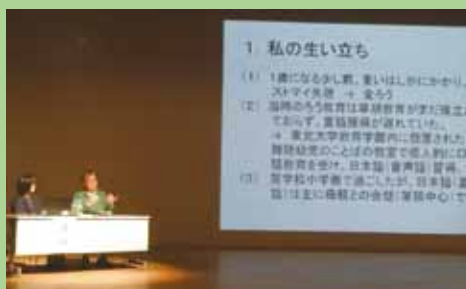
障害者理解促進啓発講演会