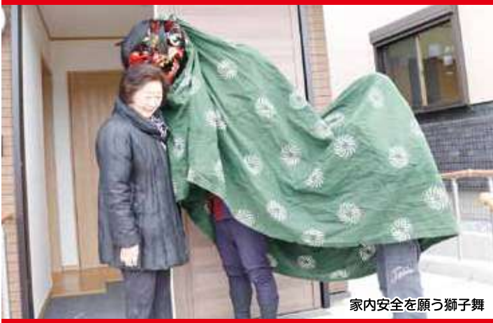
家内安全を願う獅子舞

伊勢畑地区には復興公営住宅のほか、自己再建用に14区画あり、完成済みの住宅もあります。今後、団地内に市総合支所なども整備されます。近くには硯伝統産業会館も再建予定で、地域の再生拠点エリアを形成します。