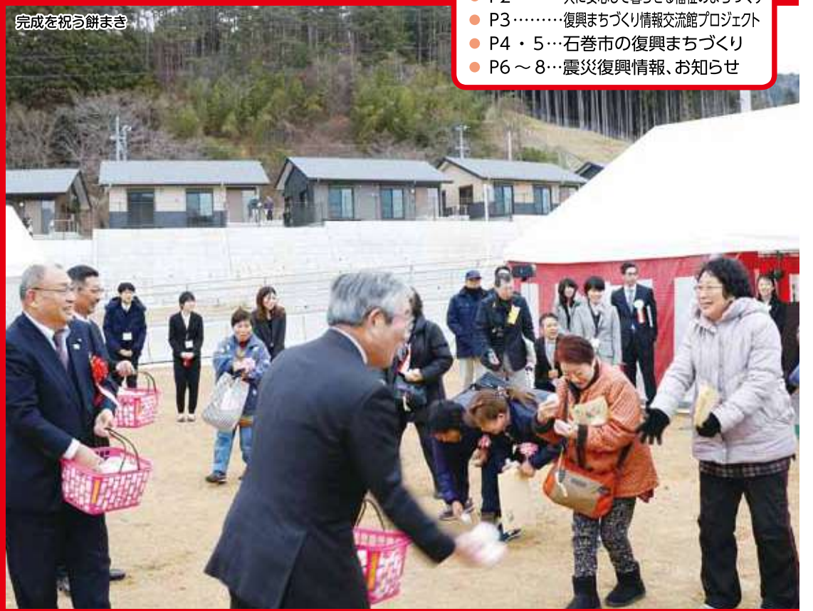
完成を祝う餅まき