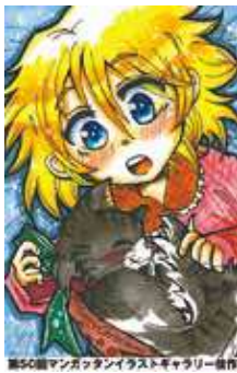
第50回マンガッタンイラストギャラリー制作

●石ノ森章太郎生誕80周年記念イベント「石ノ森検定2018」 今年も石ノ森先生の誕生日1月25日に合わせて、先生や作品、キャラクターにまつわる楽しいクイズラリーなどの「生誕イベント」を開催します。 と き 1月20日(土)～25日(木) と ころ 石ノ森萬画館 対 象 当日観覧券および年間パスポートをお持ちの方 ●マンガッタン節分イベント2018 節分を盛り上げる楽しいイベントを企画しています！ イベント参加者には「福豆」をプレゼントします。 と き 2月3日(土) と ころ 石ノ森萬画館 ●「マンガッタンイラストギャラリー春の萬画館大賞」作品募集 季節ごとにテーマを設けて、イラストを募集している「マンガッタンイラストギャラリー」。春のテーマは「ハート」。萬画館大賞の方には図書カードが進呈されます。年度末には、春夏秋冬の全応募作品から年間大賞を選出します。 テ ー マ ハート サイ ズ はがきサイズ(100 mm ×148 mm ) ※データ印刷の場合は解像度350dpi以上のもの 応募点数 1人3点まで 応募方法 はがきサイズの用紙に作品を描き、裏面に作者本人の住所・氏名(フリガナ)・年齢・電話番号を明記し、郵送してください。 ※応募作品は返却しません。また作品応募後の全ての権利は石ノ森萬画館に帰属します。 応募期限 2月23日(金)必着 応 募 先 〒986-0823 中瀬2-7 石ノ森萬画館 MIG project 2018係 ☎ 石ノ森萬画館 ☎96-5055