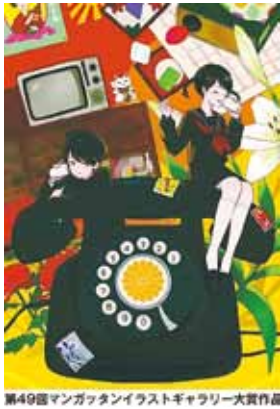
第49回マンガタンイラストギャラリー大賞作品

☎096-0823 中瀬2-7 石ノ森萬画館 MIG project2017係 ☎96-5055