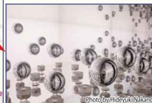
◀『石巻のためのstring(糸)』 Artist: カールステシ・ニコライ

石巻市街地周辺エリアでは、日和山より西のエリアと魚町に計11の作品が展示されました。旧石巻港湾病院は「Reborn-Art House」と名前を変え、ジャンルの異なる3組のアーティストがコラボした幻想的な作品「D・E・A・U」が展示されました。