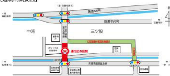
図 市区画整理第2課(内線5583) 新東総業(株) ☎96-6217