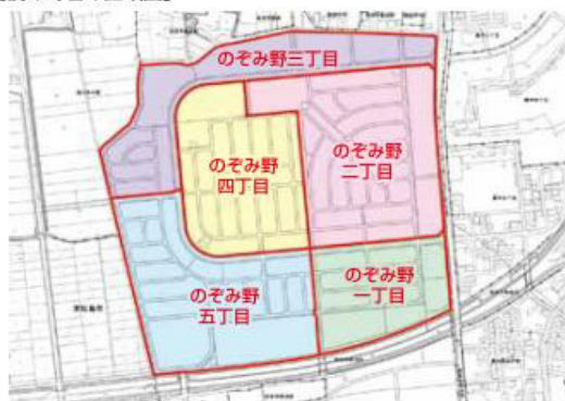
図 地域協働課(内線4236)・区画整理第1課(内線5577)