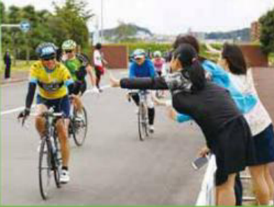
ゴール地点で完走者をハイタッチで迎える応援者