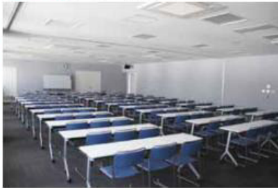
水産関係者の利用だけではなく、多目的に利用可能です。