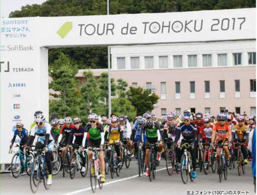
北上フォンド(100%)のスタート