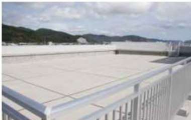
屋上は津波一時避難場所に指定されています。