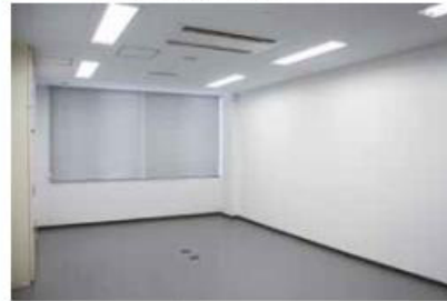
水産関係事業者が入居しています。