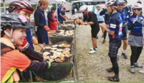
雄勝エイドステーションでホタテ焼きを味わう前に写真に収めるライダーも