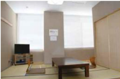
漁港に入船した船員や市場関係者が利用します。