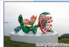
『真夜中に咲く花』 Artist: 草間彌生

牡鹿半島先端・鮎川エリアでは、カラフルなドットと海とのコントラストが印象的な「真夜中に咲く花」をはじめとしたアート作品が展示されました。