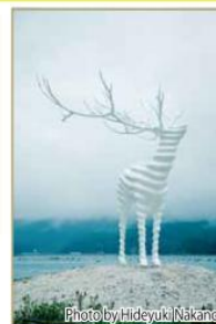
『White Deer(Oshika)』 Artist: 名和晃平

牡鹿半島中部エリアでは、貝殻の入江に「White Deer(Oshika)」がある荻浜・桃浦エリアでアート作品が展示されました。