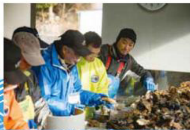
前回(銀ザケ養殖編)の作業風景