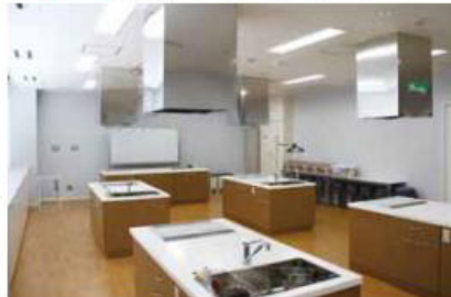
魚食文化普及のための調理実習などに利用できるよう、最新設備を揃えています。

水産総合振興センター 2階にある貸事務室および1階食堂・購買テナントへの入居を希望する事業者を募集しています。 詳しくは問い合わせください。