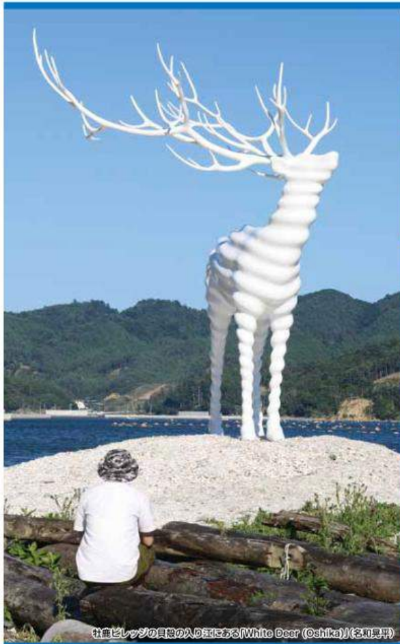
牡鹿ビレッジの貝殻の浜にある「White Deer (Oshika)」(名和晃平)