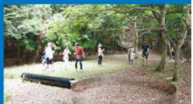
「記憶のルーベ」(鈴木康広)