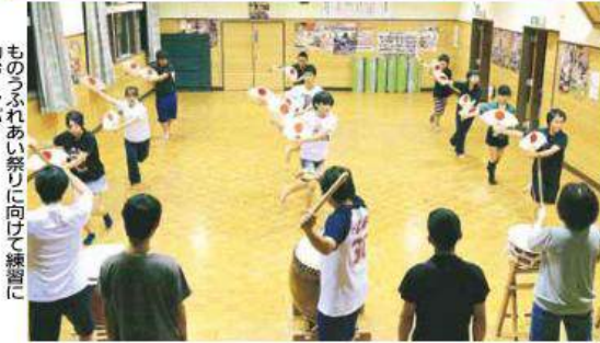
ものふれあい祭りに向けて練習に励むメンバー

ているでしょう。基本的な打ち唄で、ゆったりとした扇を持たない手踊りの歌舞子、速い唄子の馬鹿唄子の3曲があります。こうしたパリエーション豊かな踊りはそうないと思えますよ」と話します。