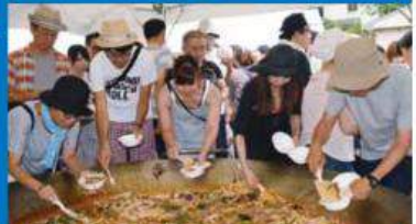
巨大な鍋で石巻の食材を使ったパエリアを提供 (オープニングイベント)