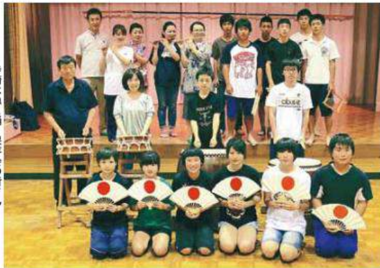
寺嶋はねこ踊り保存会の皆さん

「寺嶋はねこ踊り保存会」は4年に一度、オリンピックと同じ年に行われる、寺嶋八幡神社祭礼のみこし渡御に随伴する「踊り」です。現在は祭礼のない年にも「ものふれあい祭り」はねこ踊りフェスティバル「N桃生」が開催され、はねこ踊りパレードはそのメインとなるイベントとして多くの観客を集めています。