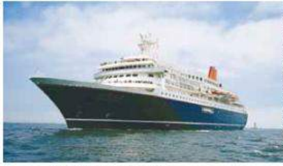
図 河川港湾室(内線5608)

東北海洋生態系調査研究船「新青丸」、海洋総合実習 船「宮城丸」、宮城海上保安部巡視船「くりこま」の3 隻が石巻港に集結します！ぜひ、ご家族連れでお越し ください。 とき 9月30日(土)午前10時～午後3時 ところ 石巻港大手ふ頭