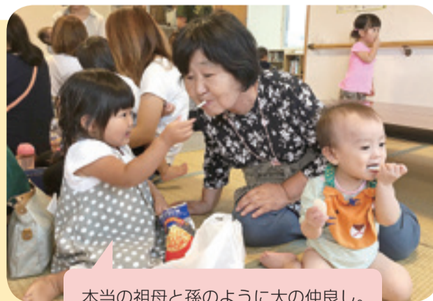
本当の祖母と孫のように大の仲良し。