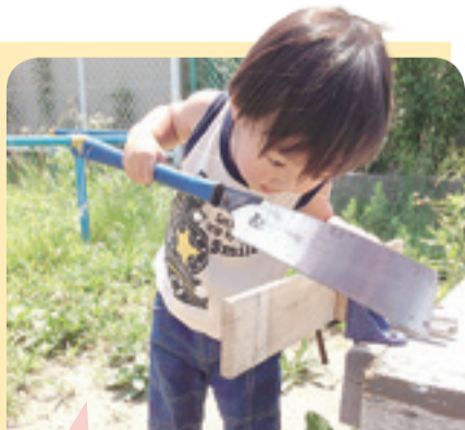
ママ達と大工さんに見守られながら、大工作业に挑戦だ。