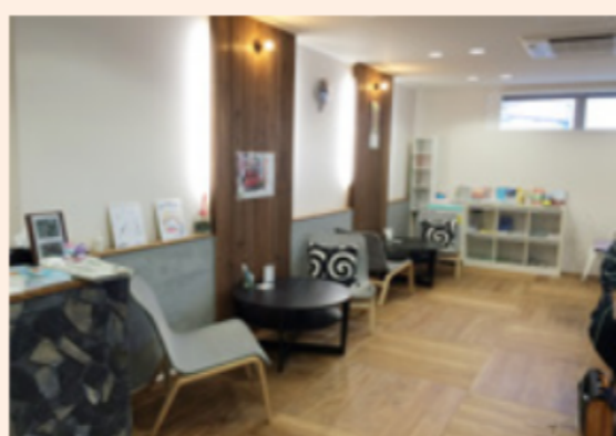
問 産業推進課(内線3544)