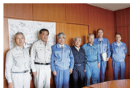
▲5月30日(月)八代市にて

災害時相互応援協定を締結している熊本県八代市へは、町内会からお預かりした見舞金もあわせてお届けしました。