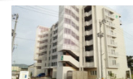
市営筒場復興住宅