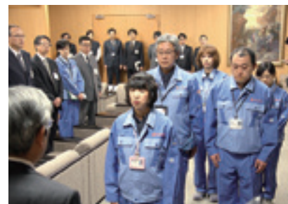
▲4月21日(木) 職員派遣出発式