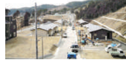
市営小網倉浜復興住宅