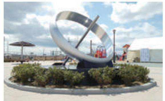
石巻あゆみ野駅前公園に設置された日時計

駅名の由来は“復興のあゆみ 新しい生活のあゆみ 未来へのあゆみ”。復興への強い思いを込めた名称です。 石巻西高校まで徒歩10分。駅前広場は駐輪場を備え、バスも停車します。