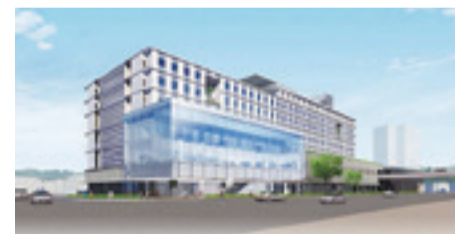
市立病院完成イメージ