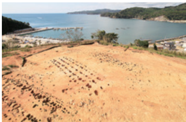
▲中沢遺跡の大型建物跡

飾り等が出土した遺物包含層がありました。また、遺物包含層には、約六千年以前に十和田火山から噴出した火山灰(十和田中振テフラ)の堆積が確認されました。女川町でも、驚神の内山遺跡(縄文時代中期、後期初)、石浜の崎山遺跡(縄文時代前期後半・後期前半、奈良時代)が発掘されています。集団移転に伴う迅速な発掘調