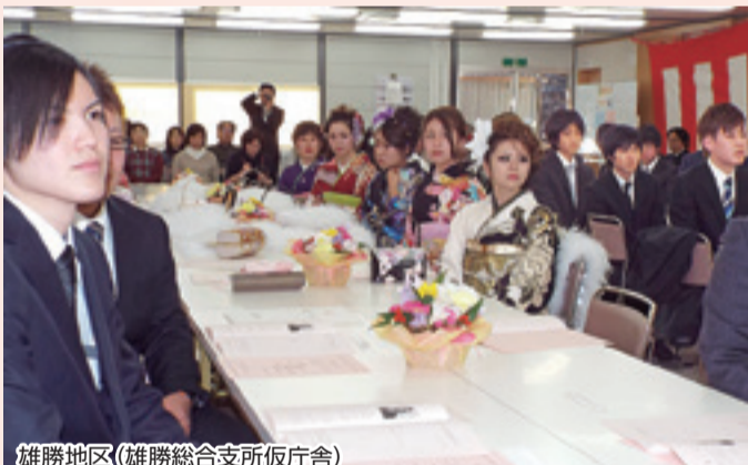
雄勝地区 (雄勝総合支所仮庁舎)