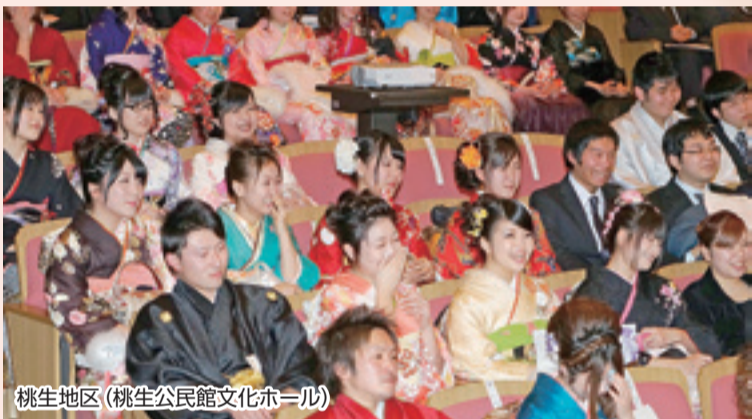
桃生地区 (桃生公民館文化ホール)