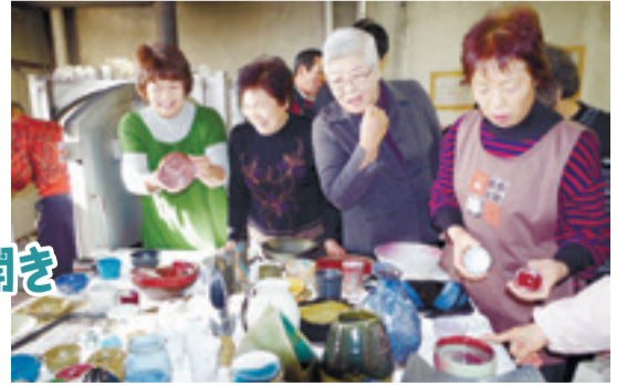
陶芸教室が初窯開き

陶芸教室で新年の初窯開きが行われました。受講者たちは、はじめに窯を清めて手を合わせ、1年の健康とより良い創作活動を祈りました。窯が開かれて昨年焼いた小皿や茶碗等の個性あふれる作品が運び出されると、それぞれ手に取って色や形をじっくりと確認しながら「とってもきれい」「上手にできた」等と笑顔で語りあっていました。