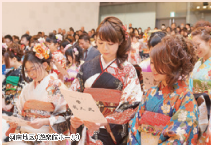
河南地区 (遊楽館ホール)