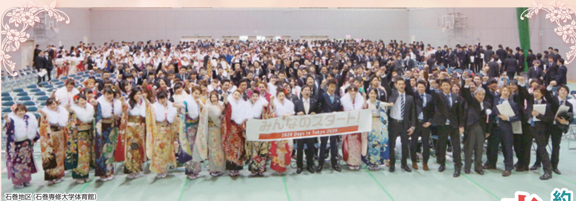
石巻地区 (石巻専修大学体育館)