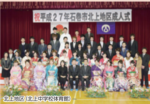
北上地区 (北上中学校体育館)