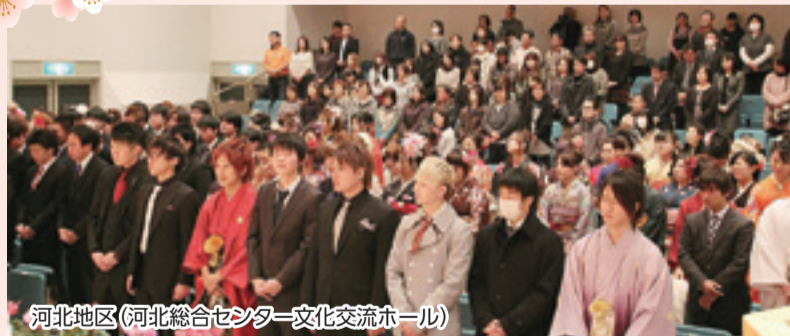
河北地区 (河北総合センター文化交流ホール)