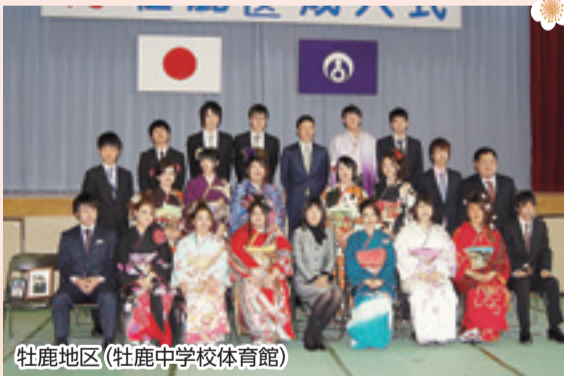
牡鹿地区 (牡鹿中学校体育館)