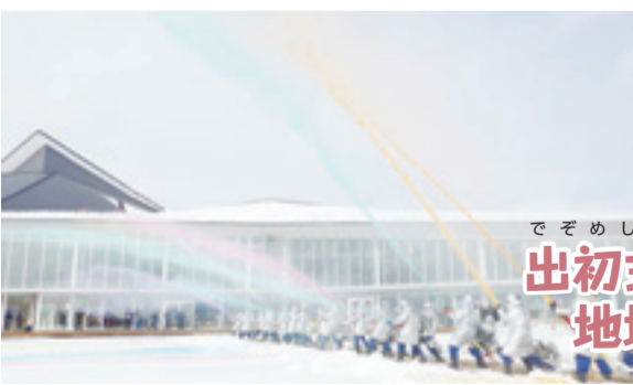
出初式で地域の安全祈願

市消防団桃生地区団の出初式には団員、来賓約250人が出席しました。昨年は、全国消防操法大会の小型ポンプ操法の部に県代表として出場し、見事優良賞に輝きました。出席者は今年も技術を高め地域住民の生命と財産を守っていくことを誓い合いました。その後、駐車場で行った一斉放水では、赤、青、紫等色とりどりの水のアーチが青空に鮮やかな線を描きました。