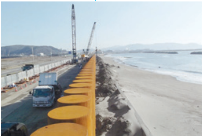
現在の様子 (3工区のうち1工区を掲載しています)