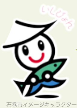
石巻市イメージキャラクター