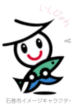
石巻市イメージキャラクター