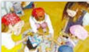
問 健康推進課(内線2617)