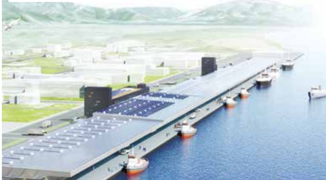
新石巻魚市場のイメージ図(全景)

石巻魚市場の旧施設は、昭和49年に建設され、上屋根の長さ(約650メートル)と水揚げ岸壁の長さ(約1,200メートル)は、いずれも日本一の長さを誇っていました。