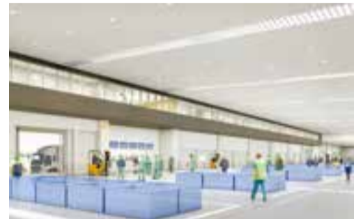
新石巻魚市場のイメージ図(荷捌き室)