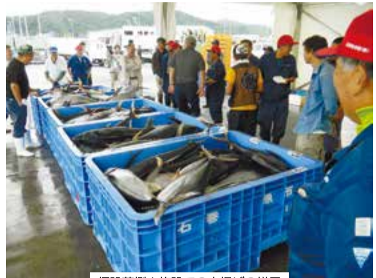
仮設荷捌き施設での水揚げの様子