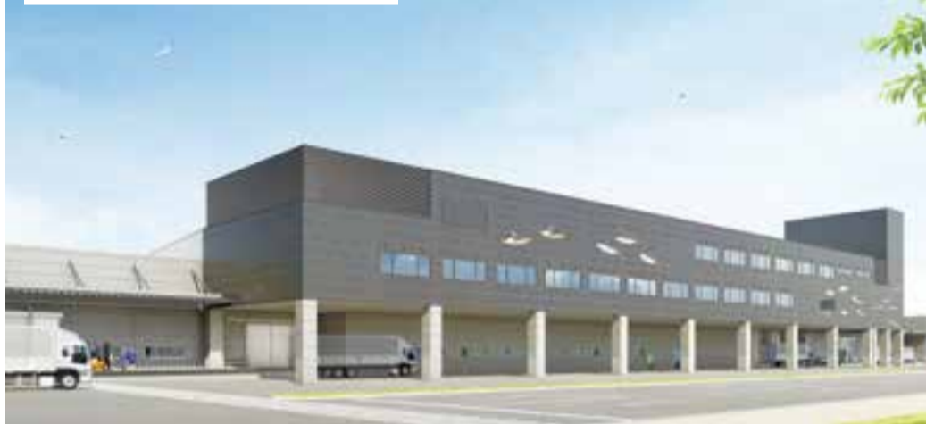
新石巻魚市場のイメージ図(管理等)

新施設は、中央棟、東棟、西棟の3棟で構成。上屋根の長さは、旧施設の約1.4倍(約880メートル)となる予定です。国内のみならず海外への輸出も視野に入れた漁獲物の付加価値向上を実現する「高度衛生管理型施設」となります。