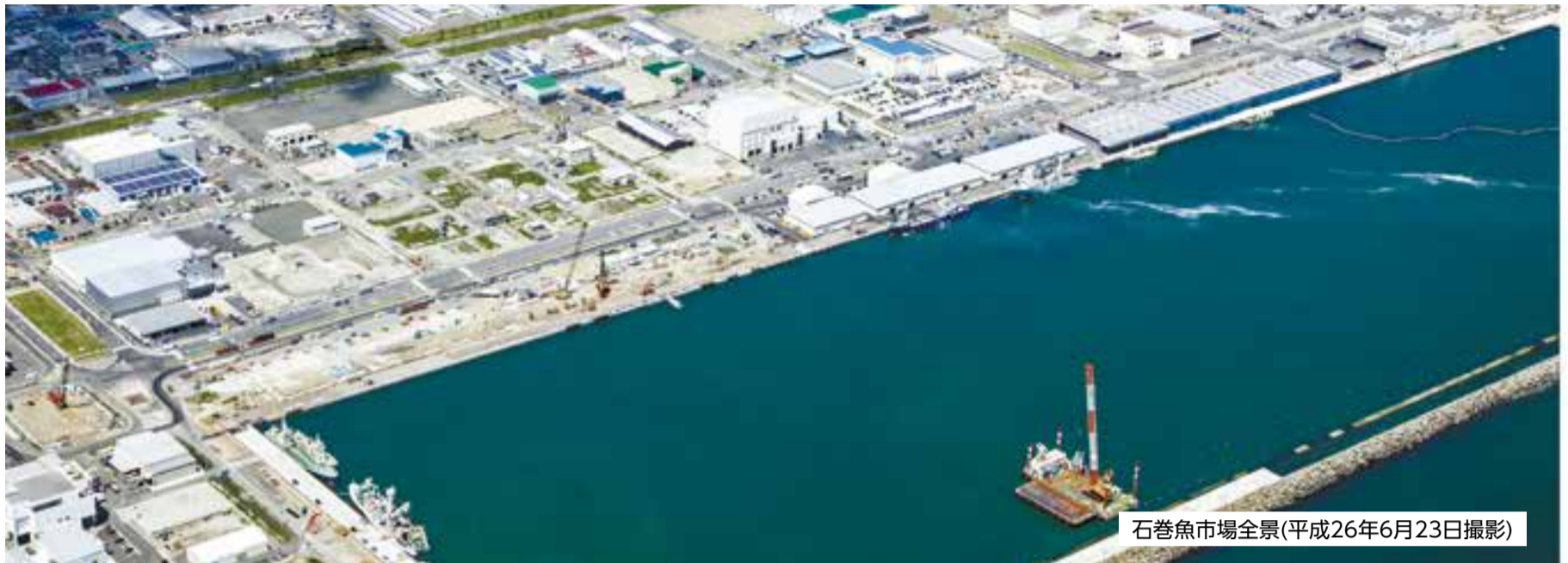
石巻魚市場全景(平成26年6月23日撮影)