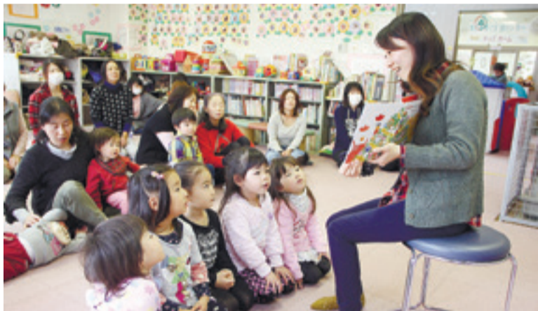
▲子どもたちをお話の世界に引き込む読み聞かせ活動 (桃生子育て支援センター「キッズホーム」)

主に小学校や子育て支援センターなどに出向き、子どもたちを対象に絵本や紙芝居の読み聞かせを行っています。年齢と発達に合わせた上で「分りやすく、楽しく、季節にあつた本」を選ぶように心がけています。また年