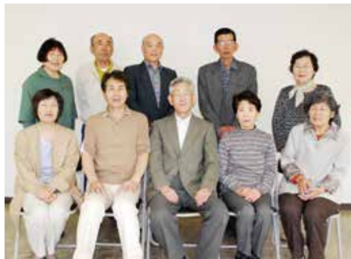
▲創作活動を楽しむ「川柳ふうせん座」の皆さん