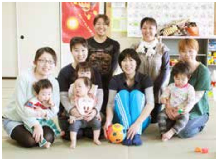
▲いつも笑顔の「MAMAリフ」の皆さん

☎ 秘書広報課(内線4025) ☎ 986-8501(住所不要) Eメール ispubinfo@city.ishinomaki.lg.jp