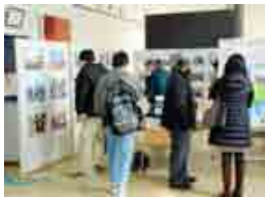
▲石巻市フォーラム2013