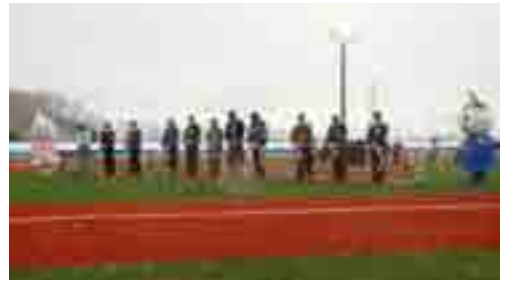
▲石巻市民球場オープニングセレモニー