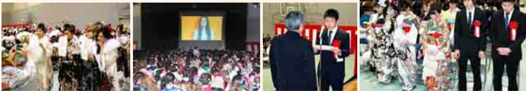
石巻地区 (石巻専修大学体育館)