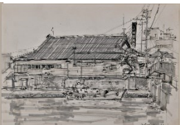
「劇場」 展示会場 旧観慶丸商店