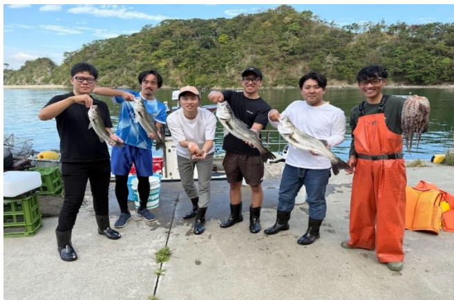
二地域居住モデル事業 （漁業体験の様子）

本市への継続的な人の流れを生み出すことで、 関係人口の拡大と地域活性化を図るほか、地域産業の担い手不足の解消も推進します。