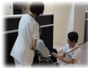
医療・介護分野の人材確保

地域包括ケア を推進していくうえで、医療・介護・福祉分野の専門職員の人材確保のため、看護師や保健師のほか、保育士、助産師等を対象とした奨学金返還支援（6年最大60万円）を行い、妊娠・出産・育児の一貫した 子育てしやすい環境づくり を推進します。