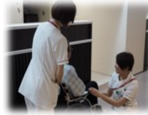
医療・介護分野の人材確保

地域包括ケアを推進していくうえで、医療・介護・福祉分野の専門職員の人材確保のため、看護師や保健師のほか、保育士、助産師等を対象とした奨学金返還支援（6年最大60万円）を行い、妊娠・出産・育児の一貫した子育てしやすい環境づくりを推進します。