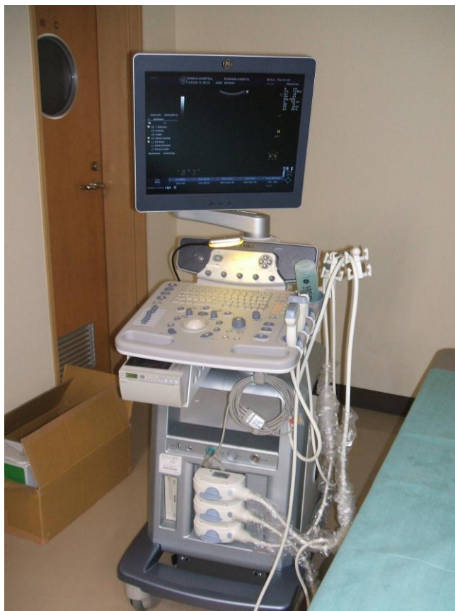
牡鹿病院に新規導入された超音波診断装置