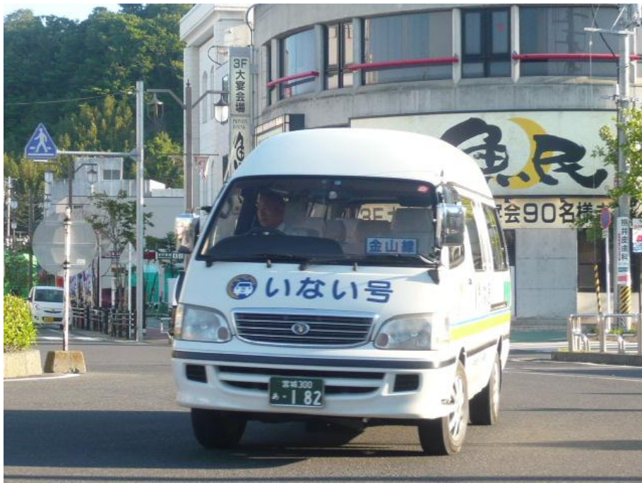
石巻駅前を運行する住民バス「いない号」