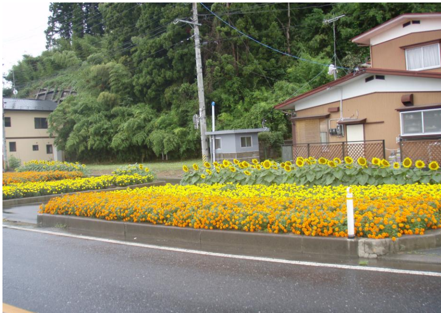
「花いっぱい運動」による花の植栽後の 石巻市北村字東柳沢地内（国道 108 号線）