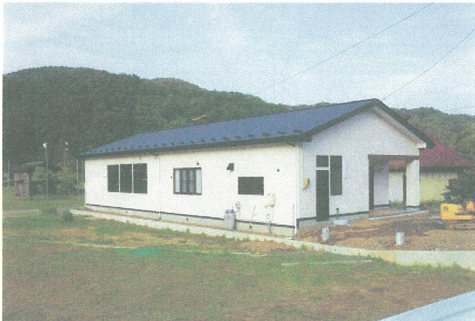
完成後の北上公民館女川分館