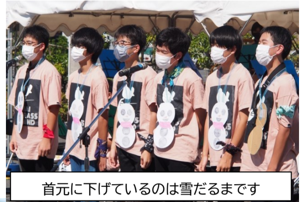
首元に下げているのは雪だるまです

トップバッターとして登場した稲井中吹奏楽部は, 幅広い年齢層に合わせて曲目を選んだり, かわいい(?)セーラームーンが登場したりと, 工夫した演奏(そして歌)を披露しました。応援に来ていただいた保護者の皆様ありがとうございました。