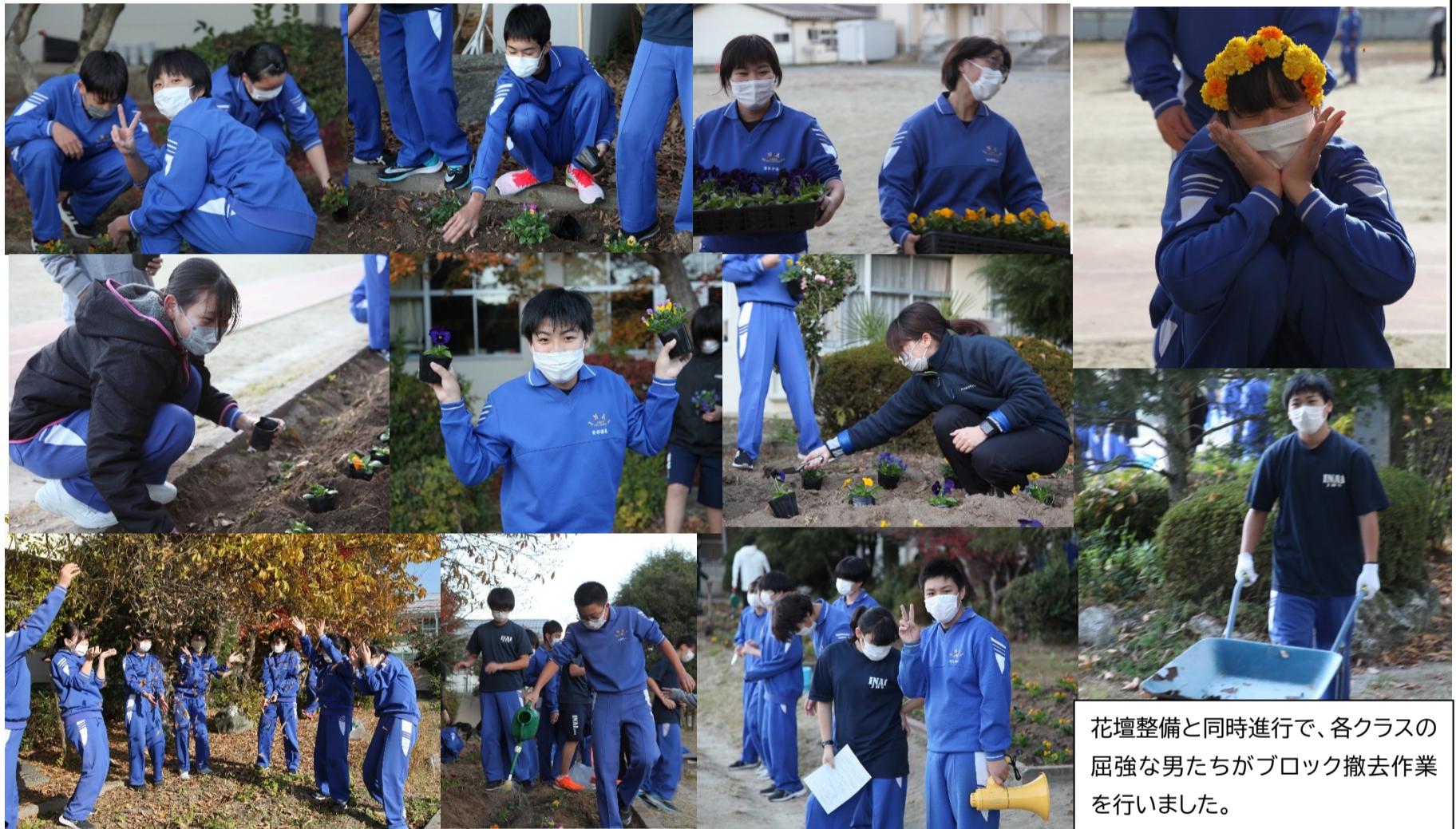
花壇整備と同時進行で、各クラスの屈強な男たちがブロック撤去作業を行いました。

○11月15日(火)に花壇整備を行いました。今年最後の作業となりましたが、生徒たちは楽しそうに作業を行っていました。