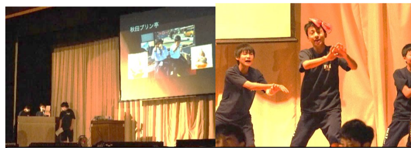
第1学年発表「いぶり GAKKO」秋田芸術研修の成果発表と、わらび座ソーランをノリノリで披露しました。頑張れわらび座！