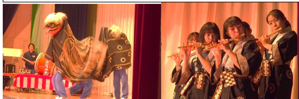
井内獅子舞は迫力の演技。この日のために夜も練習を積み重ねた成果が発揮されました。地域の伝統は稲井中生が引き継いでいきます！