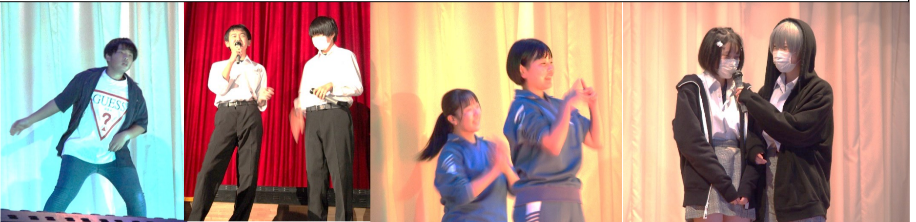
有志参加のステージ発表は、それぞれの個性を生かし、素晴らしくも楽しい発表ばかりでした。ステージも観客もみんな笑顔だったのが印象的でした！