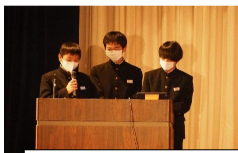
第2学年発表「未来に向けて」 上級学校訪問で学んだことを発表しました。