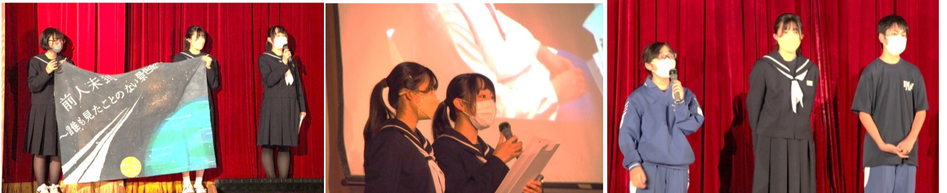
生徒会旗の紹介からスタート！執行部からは夏休みに行われた「Stop いじめフォーラム」での実践発表と、新生徒会長、副会長の紹介が行われました。