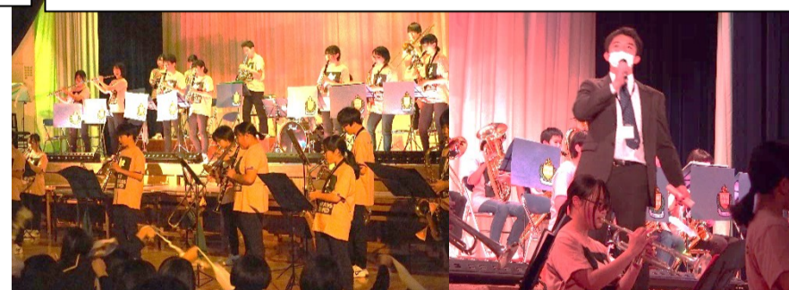
発表の最後は吹奏楽部の演奏です。素晴らしい演奏、3年生とのコンビネーションも光りました。「真綿色したシクラメンほど～(尚士先生)」