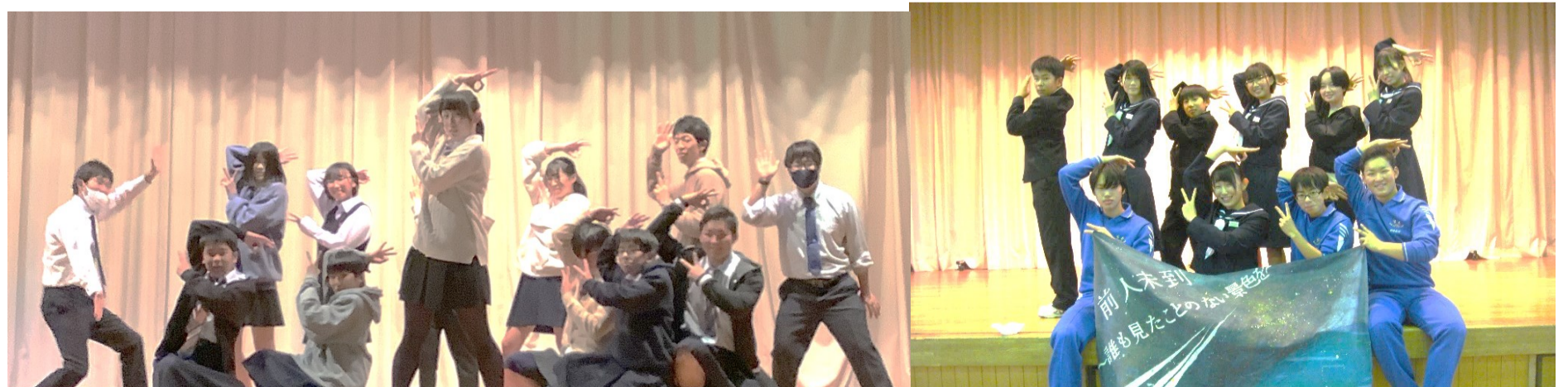
前日祭の最後を飾ったのは生徒会執行部のダンス。ばっちり決まりましたね。あれ、生徒以外の人も？ 執行部の皆さん、お疲れさまでした