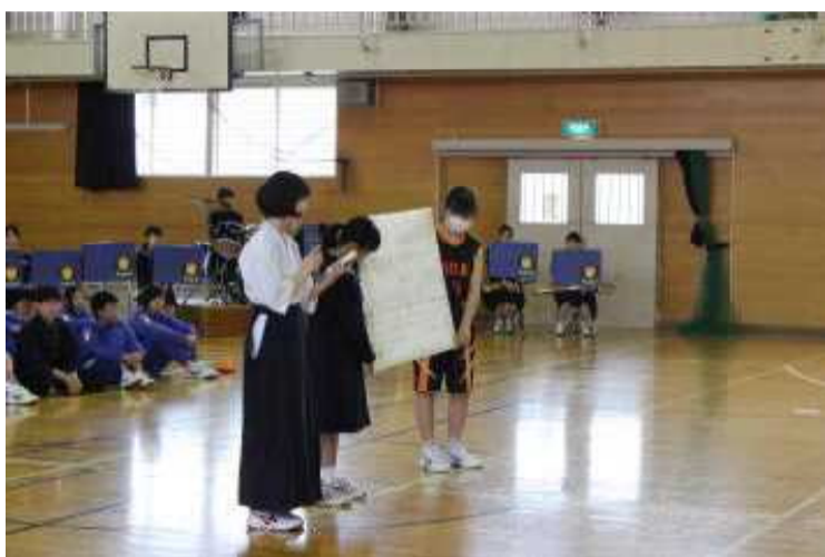
生徒会役員による組織の説明