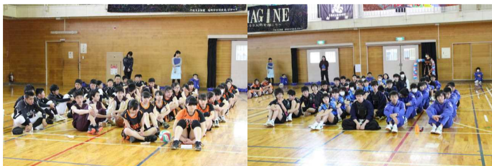
各部とも趣向を凝らした紹介を行いました