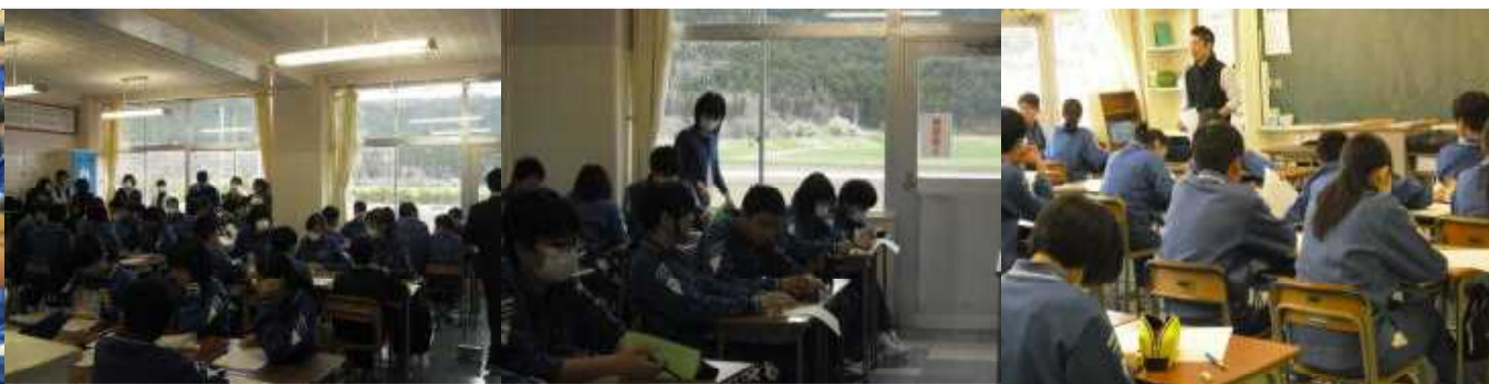
各学年とも「学級目標を決めよう」に取り組みました