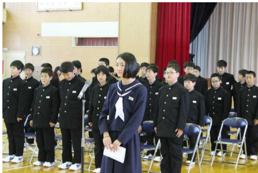
御礼の言葉を述べる1年生代表