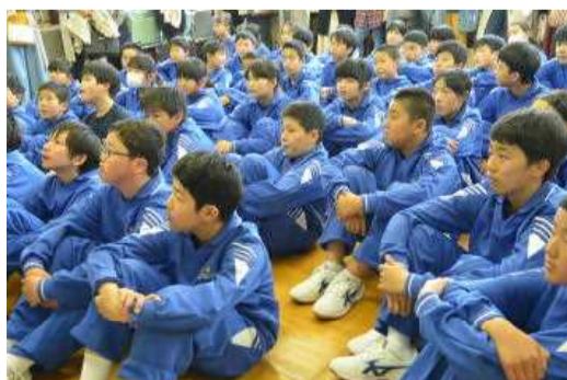
真剣に説明に耳を傾ける生徒