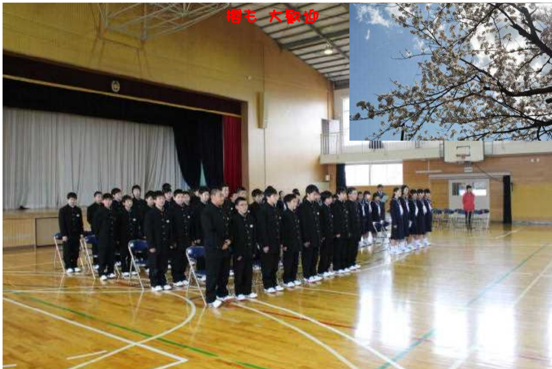
先輩を前に緊張した面持ちの1年生

11日に行われた「新入生を迎える会」では、2・3年生による部活動紹介や、稲中生の約束、稲中生徒会組織の説明が行われました。また19日には希望する部活への正式入部も果たし、元気に活動に励む姿も見られるようになりました。今後は将来に夢と志をもち、目指す道に向かってしっかりと中学校生活を送ってほしいものです。