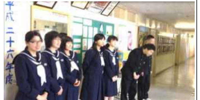
▲4月から地道に続けている活動です。ご苦労様です。

毎朝、昇降口で「おはようございます」と登校してきた生徒に声をかける「朝のあいさつ運動」。生徒会執行部と学級委員が中心となって4月から取り組んできました。もうすぐ1学期が終わりですが、成果が十分表れ、日常生活の中で「おはようございます」「こんにちは」「さようなら」というあいさつが自然に交わされるようになってきました。執行部・学級委員の地道な活動が実を結んでいます。1学期間ご苦労様でした。これからもよろしくお祈りいたします!