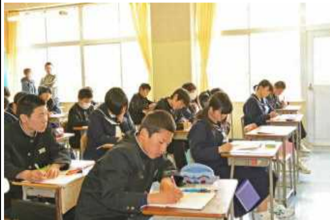
▲4月に行われた授業参観から

さて、今週金曜日には授業参観を実施します。地区懇談会後の授業参観とは異なりますが、多くの方々の参観並びに学年PTAへご参加をお待ちしております。