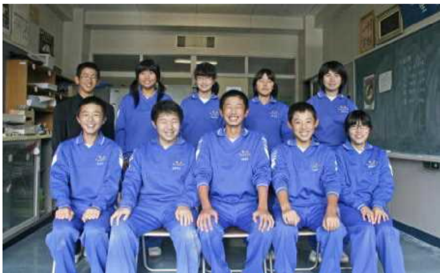
◀ 新執行部 10名で頑張ります!