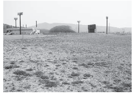
総合運動公園の未整備地