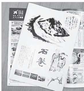
新しい観光ガイドブック

の観光ガイドブックを三万部、観光ポスター二種類を各五百枚作成し、東北自動車道のサービスエリアをはじめ、県内外の観光施設等への掲示を行い、PRに努めることとしているほか、首都圏をはじめ、東北各県への観光キャラバンの実施や姉妹都市等でのイベント参加など、より多くの機会をとらえて、石巻をPRしたいと考えている。