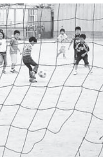
学校で遊ぶ子どもたち