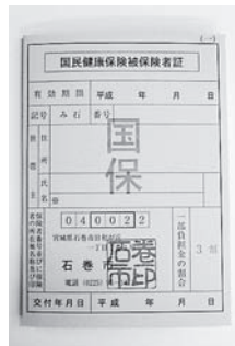
国民健康保険被保険者証

桃生、北上の二地区については、財政収支の見込状況及び財政調整基金割合五パーセントが確保されていることから、今回は税率の改正を行わないこととしたが、今後の保険税率の統一時期については、平成二十年度の国保会計の運営状況等を見ながら判断していきたいと考えている。