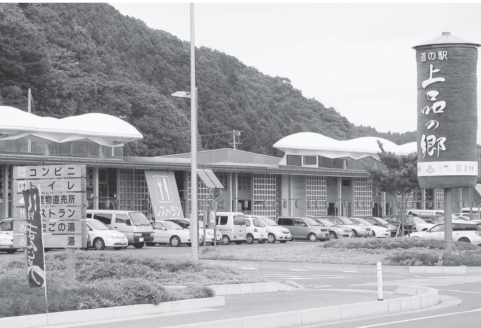
じょうほん さと 地産地消に取り組む道の駅「上品の郷」