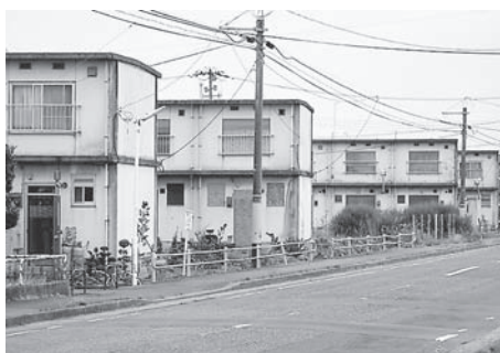
老朽化する市営住宅

要なものについては、地域住宅交付金を活用して、年度計画により住環境の整備を行っている。また、石巻県職員宿舎一号棟は、昭和四十五年に建設された鉄筋コンクリート造り三階建の建物であり、利用する職員が少なくことから平成十八年度末に用途廃止したが、同じ敷地内に県職員宿舎二号棟があり、二号棟については、今後も使用する予定であることから、敷地の関係上一号棟部分だけの処分は考えていないとのことであった。