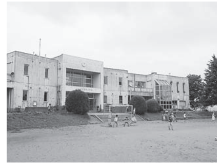
増築予定の須江小学校

なお、供用開始の時期については、工事完了を本年度末としていることから、平成二十一年四月を予定している。