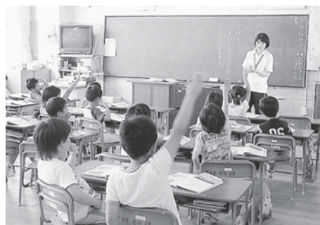
小学校の授業の様子