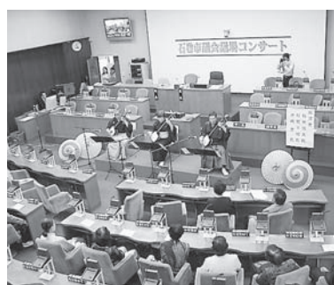
第2回議場コンサート

当日は、市民をはじめ、市職員や議員など約百二十名が来場し、津軽三味線のダイナミックな演奏を楽しみました。 議会では、今後も議場コンサートを行う予定です。市民の皆さんのご来場をお待ちしています。