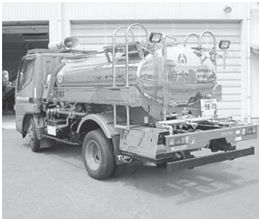
石巻地方広域水道企業団の給水車

また、災害時の飲料水確保は何よりも大切であるので、各家庭においては日頃から三日分の備蓄に努めるよう、啓発を行っていく。