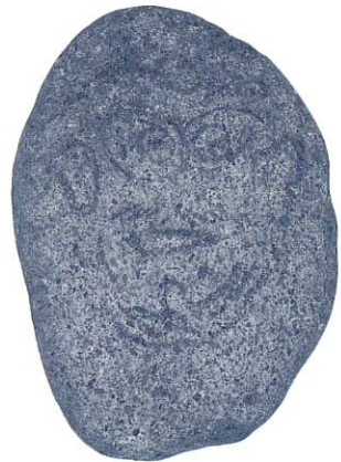
▶多賀城市新田遺跡出土 顔面素描礫石 (同市埋文センター所蔵)