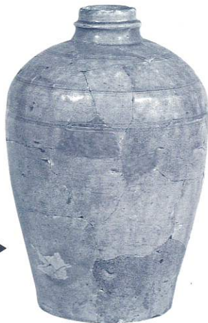
名取市熊野堂大館跡出土▶ 古瀬戸瓶子 (同市教委所蔵)