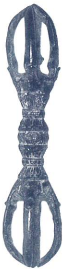
▲五鈷杵 (涌谷町篁峯寺所蔵)