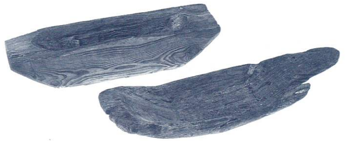
▲多賀城市新田遺跡出土 舟形木製品 (同市埋文センター所蔵)