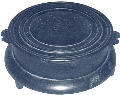
▲伏鈕 (涌谷町篁峯寺仁王堂所蔵)