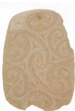
△重要文化財 岩版 （登米郡米山町網場出土）