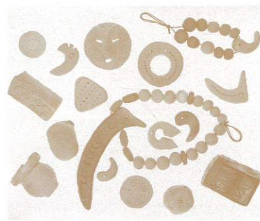
△プレゼントの「縄文グッズ」各種