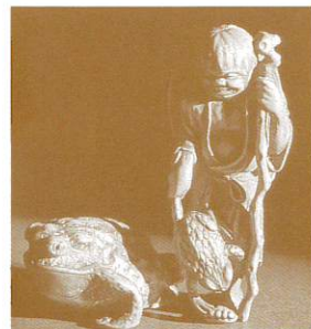
△根付け「仙人とカエル」