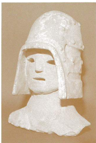
△埴輪「冑をかぶる武人」

開館満10周年を記念し、国内のみならず、世界的にも著名な常民文化コレクションといわれる故毛利総七郎氏の多岐にわたる収集品のうちから代表的な資料を選び、その一部を公開します。数多くの収集品を通じ、故毛利総七郎氏の庶民生活文化用具の保存収集に対する先見性また、学術研究や教育普及に果たした同氏の役割を改めて振り返って見ます。ハニワ、和鏡、浮世絵、油壺、印籠根付、化粧用具、矢立、花巻人形、アイヌ関係資料など300余点を陳列。