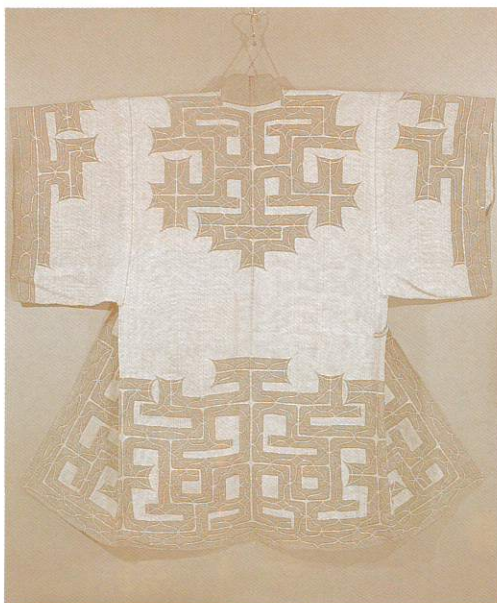
△アイヌ上衣「アットウシ」