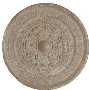
▲三角縁神獸鏡 (伝)物集女(京都府) 明治大学考古学博物館 蔵