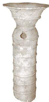
▲朝顔形埴輪 舟塚古墳 茨城県立歴史館 蔵