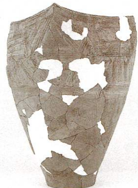
▲続縄文土器 新金沼遺跡 石巻市教育委員会 蔵