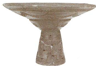
▲弥生土器(高坏) 中在家南遺跡 仙台市教育委員会 蔵