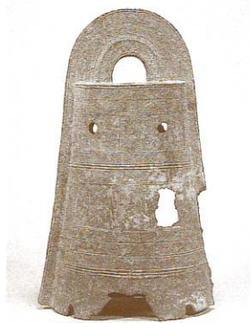
▲袈裟襟文銅鐸 明治大学考古学博物館 蔵