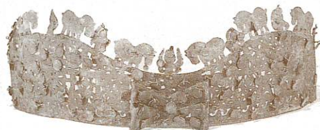
▲金銅製馬飾付冠 三昧塚古墳 茨城県立歴史館 蔵 (※企画展では玉造町教育委員会所蔵 金銅製馬飾付冠(複製品)を展示)