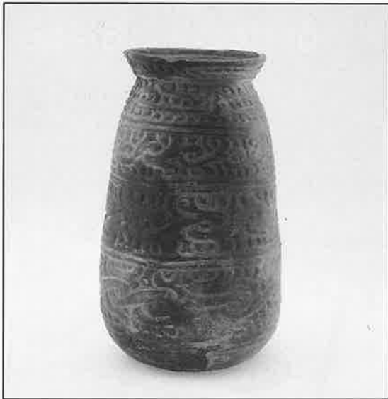
◀ 壺型土器 (青森県・亀ヶ岡遺跡) 毛利伸氏所蔵