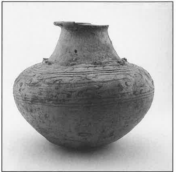
▶ 壺型土器 (気仙沼市・西中才貝塚) 気仙沼市教育委員会所蔵