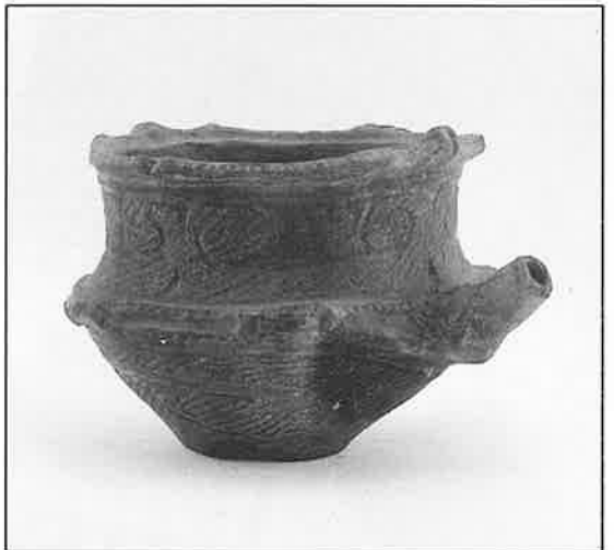
▶ 注口土器 (南方町・平貝塚) 毛利伸氏所蔵