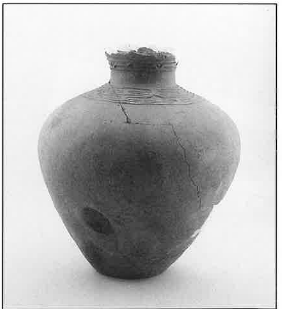
▶ 壺型土器 (気仙沼市・川上地区) 気仙沼市教育委員会所蔵