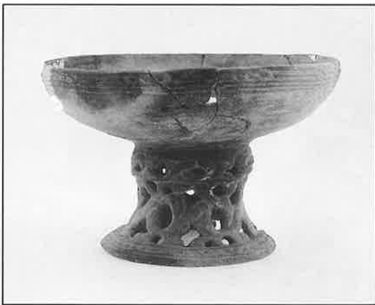
◀ 高坏型土器 (河北町・南境貝塚) 後藤勝彦氏保管