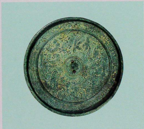
◀ 洲浜牡丹蝶鳥鏡(鎌倉時代) 女川町・照源寺