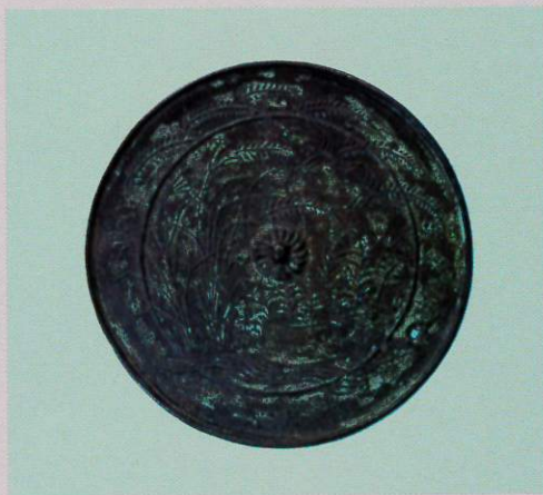
◀ 流水秋草飛雀鏡(平安時代) 石巻市・毛利コレクション