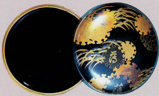
◀ 蒔絵鏡箱(江戸時代) 石巻市・毛利コレクション