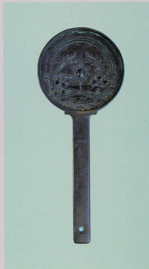
◀ 蓮葉柄鏡(室町時代) 石巻市・毛利コレクション