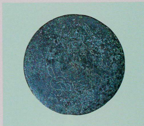
◀ 線刻如来鏡像(室町時代) 石巻市・毛利コレクション