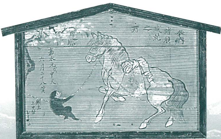
猿駒曳き 桜神社所蔵(河北町中野)

石巻地方にもたくさんさんの絵馬が奉納されてきました。今回はこの中から、代表的なものを選び展示します。絵馬は時代を写す鏡ともいえるでしょう。切実な願いや画題の意味するもの、素朴なものから豪華なものまでバラエティーに富んだ絵馬から、時代時代の人々の祈りや、石巻地方の暮らしぶりを概観します。