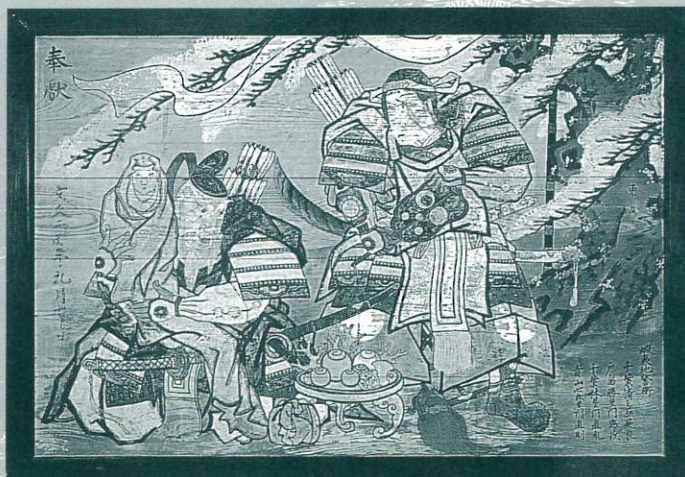
神功皇后と武内宿禰 白鳥神社所蔵(桃生町中津山)