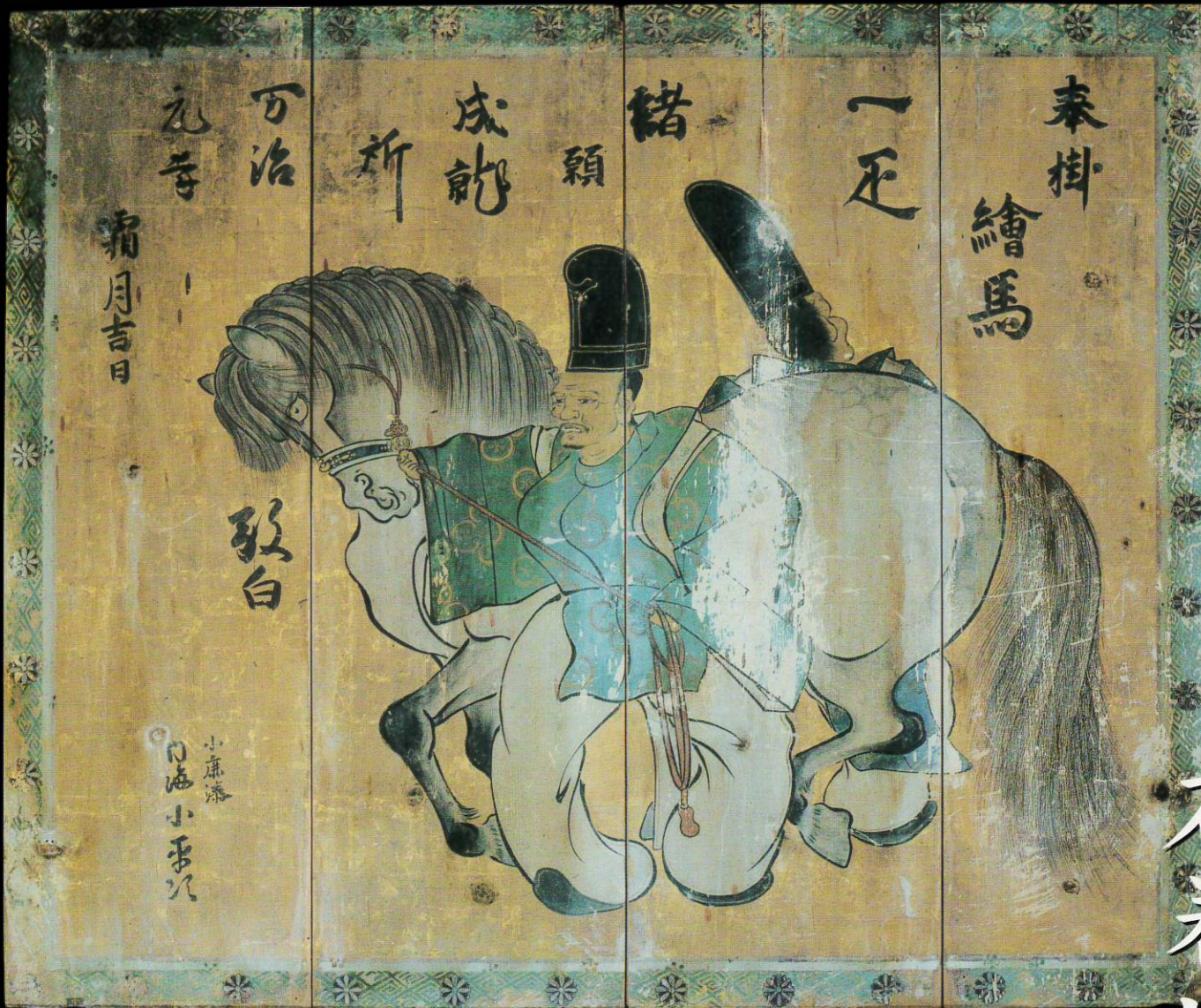
曳き馬(石巻市指定文化財) 零羊崎神社所蔵(石巻市牧山)