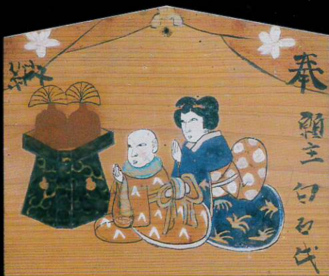
母子拝み 長谷寺所蔵(石巻市真野)

2002年 6月21日金 — 8月25日日 当館学芸員による展示解説 6月23日日・7月28日日 (それぞれ午後2時から)