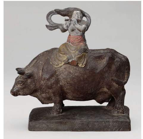
高橋英吉《少女と牛》 1939年 木・彩色

観覧料 一般 500円 / 高校生 300円 / 小中学生 150円 ※上記料金で常設展も観覧できます。 ※20名以上の団体は2割引 ※11月3日(水・祝日)は無料で観覧いただけます。