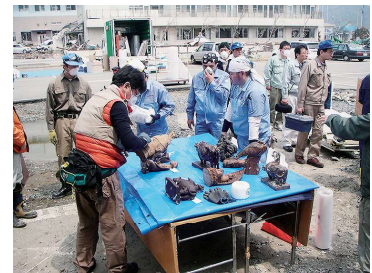
平成23年4月 文化財レスキューの様子

主催 石巻市博物館 共催 公益財団法人石巻市芸術文化振興財団 後援 tbc東北放送、 ミヤギテレビ 、東日本放送、 仙台放送 、 NHK 仙台放送局、河北新報社、三陸河北新報社(石巻かほく)、石巻日日新聞社、ラジオ石巻FM76.4