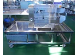
フードスライサー

たくさんの方々より多大なるご支援をいただきました。本当にありがとうございました。 みなさん、感謝の気持ちを忘れず、給食を残さず食べましょう!