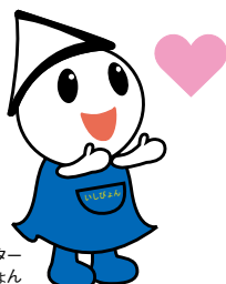
石巻市観光PRキャラクター いしびよん