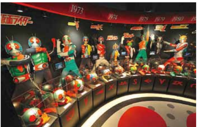
「仮面ライダーの世界」

・アクセス 【船着場まで】 鉄道/JR石巻駅よりミヤコーバス「市内(山下行き)線」乗車で約15分。「網地島ライン前」下車車/三陸自動車道石巻河南ICより約20分 【船着場から田代島まで】 網地島ラインで約50分(料金片道 1,230円) 【島から施設まで】 仁斗田港下船 徒歩約15分 ④石巻市観光課 TEL:0225-95-1111 ・所在地 石巻市田代浜字敷島24