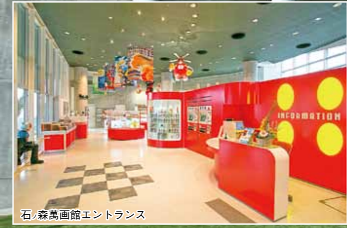
石ノ森萬画館エントランス