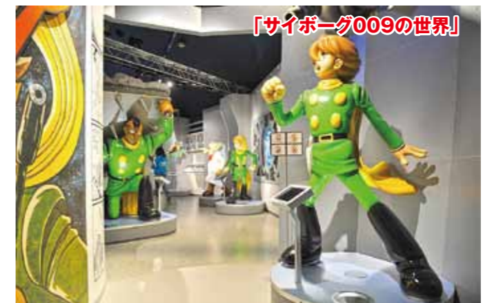
「サイボーグ009の世界」

・営業日・営業時間 9:00~18:00(12月~2月→17:00まで) ※入館は閉館の30分前 ・料金 大人 800円/中高生 500円/小学生 200円/未就学児 無料 ・定休日 第3火曜日(12月~2月→毎週火曜日) ※GW及び夏休みは無休 ※年末年始は無休 ・駐車場有無 有:中瀬公園奥に臨時駐車場130台 ・アクセス 鉄道/JR石巻駅より徒歩約12分 車/三陸自動車道石巻河南ICより約15分 ④石ノ森萬画館 石巻市中瀬2-7 TEL:0225-96-5055 FAX:0225-96-5045 MAP P18 L-3