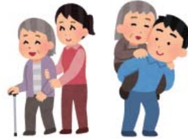
コミュニティによる支え合い