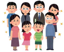
地域ぐるみの子育て

地域での出来事に関心を持ち、地域ぐるみの見守りやボランティア活動に参加しましょう。