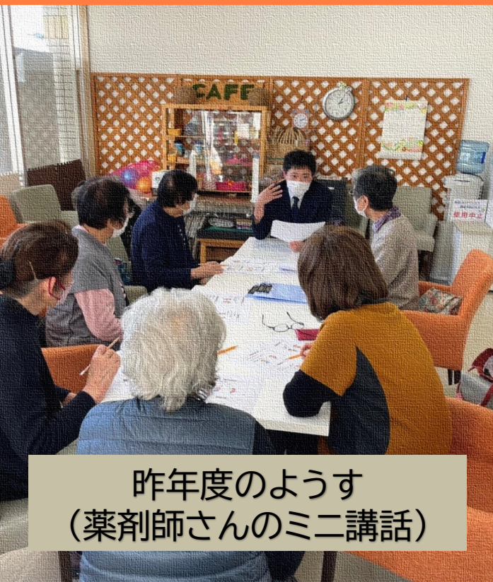
昨年度のようす (薬剤師さんのミニ講話)

認知症の人やその家族、地域の人、介護・福祉・医療の専門職など、だれでも気軽に集うことのできる場所づくりを目的とした「石巻つながりカフェ」事業のひとつとして、石巻市湊地域包括支援センターが月1回、第3木曜日に開催しています。