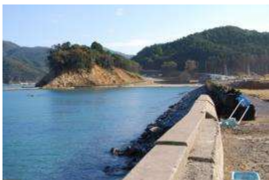
大谷川浜護岸堤防

震災前には、水門の近くの砂浜にハマボウフウやハマニンニクの群落を観察しているが、今回の調査では確認できなかった。