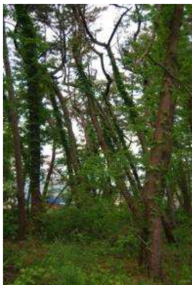
傾いているクロマツ

海岸性の植物としては全体的にオオバイボタ、マサキ、テリハノイバラの出現が目立ち、常緑樹種ではアオキ、ヤツデ、マルバシャリンバイ、ヒイラギ、イヌツゲが出現するが個体数は少ない。草本層では、常緑のヤブコウジ、キズタが優占する部分とイネ科草本の優占する部分があり、外来植物の出現が普通である。海側の林齢の若い部分では、外来種の優占度が高くなる。