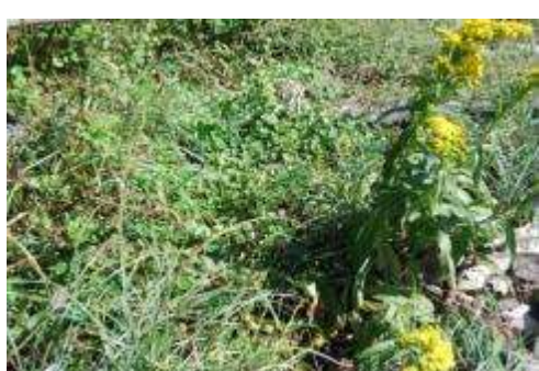
ハマヒルガオとトキワアワダチソウ