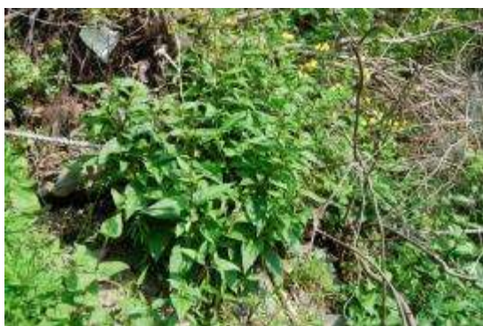
ハマヒナノウスツボ

浜の東側に、上部はケヤキ・ヤブツバキ群落、下部は礫浜となる傾斜約60°の崖地が数10m続いている。海面から約1~4mの間に群生するハマヒナノウスツボと少数のハマギク、ハマボスが確認された。ほかに多く観察されたのはヤクシソウ、ヒキオコシ、クサノオウ、ヒヨドリジョウゴなどである。