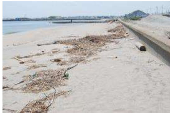
砂浜：西工業港側・植生なし