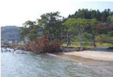
クロマツ群落とわずかに残った砂浜