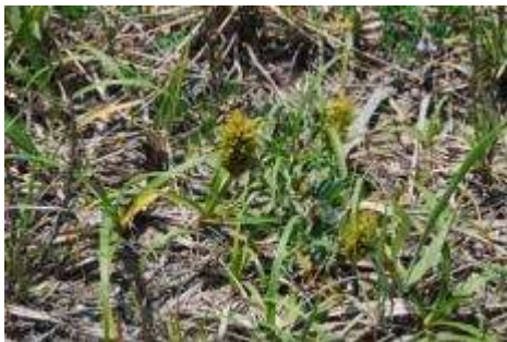
コウボウムギ群落

海浜植物群落はハマエンドウ群落、コウボウムギ群落、ハマニンニク群落、ハマヒルガオ群落、ギョウギシバ群落、コウボウシバ群落、テリハノイバラ群落が確認された。全体にトキワアワダチソウ、ヘラオオバコ、メマツヨイグサ、コマツヨイ、ヒメグンバイナズナなどの外来植物の混生が目立つ群落となっている。