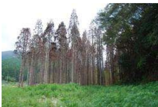
東・沢沿いのスギ植林地