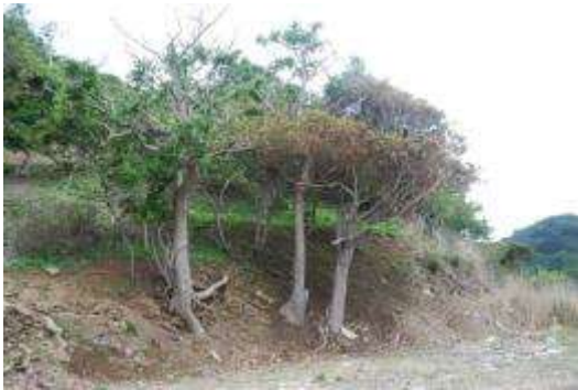
漁港後背地のタブノキ