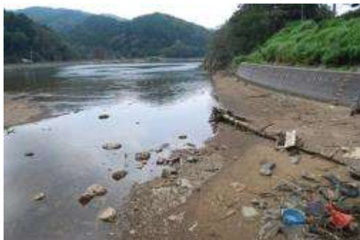
ハママツナの元の生育地