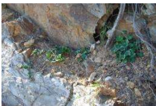
崖地のハマヒルガオとアオツツラフジ