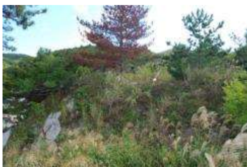
枯れたクロマツ（上部）