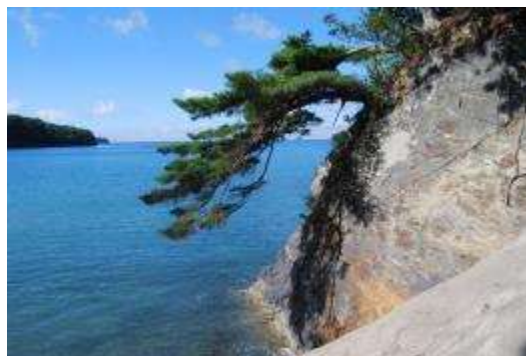
北側の海岸・崖地