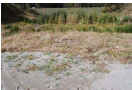
砂地と湿地：コウボウシバ・