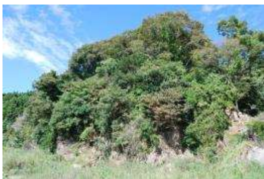
後背地のケヤキ群落

集落と漁港は家屋の流失と地盤沈下でほとんど空地化して、外来植物の多い一年生草本を主にした群落となっている。「写真」