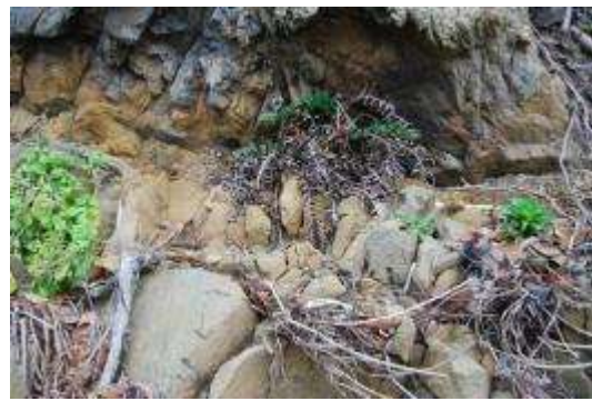
ツルナ、ハマギク、オニヤブソテツ