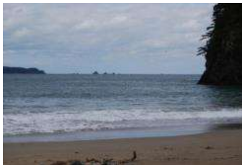
浜前景（前方は出島と四つ子島）