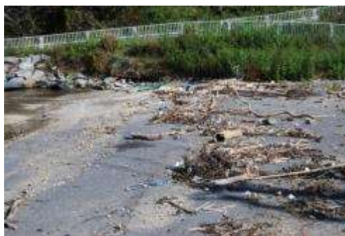
佐須浜漁港北側岸壁周辺