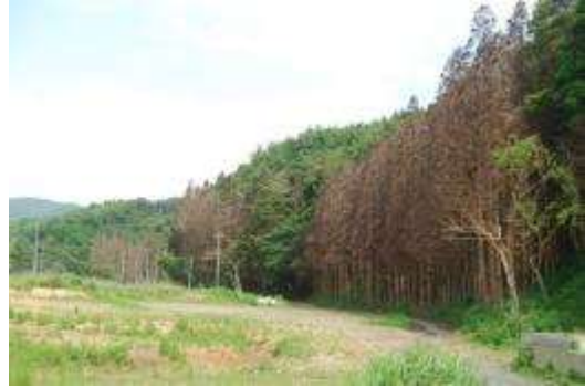
水たまり周辺の枯れたスギ