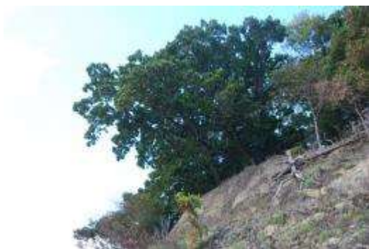
崖上のカシワ群落