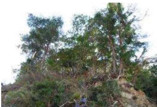
南側の植生：アカマツ・コナラ