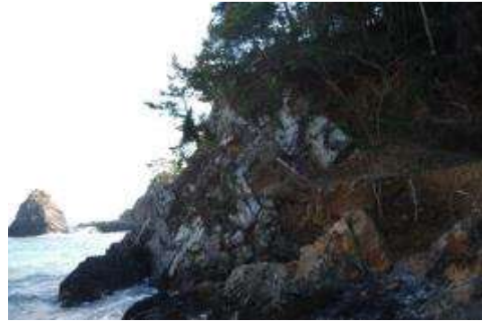
浜の南側の崖下部