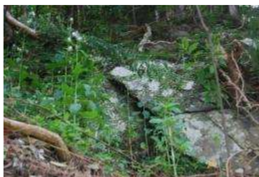
ベニバナボロギクと岩に着生しているマメヅタ