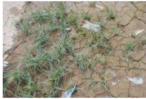
コウボウシバ群落