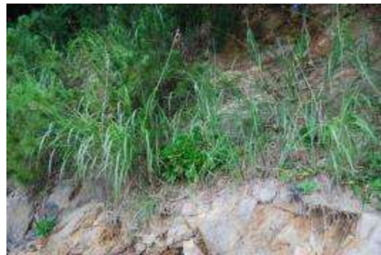
ススキとハマギク