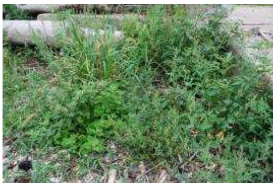
ツルナ・ハマアカザ

防潮堤の陸側では、沢の東側で面積およそ10㎡のハマアカザ群落、コンクリートの隙間にハマヒルガオ、礫の多いところでテリハノイバラをそれぞれ1株ずつ確認した。