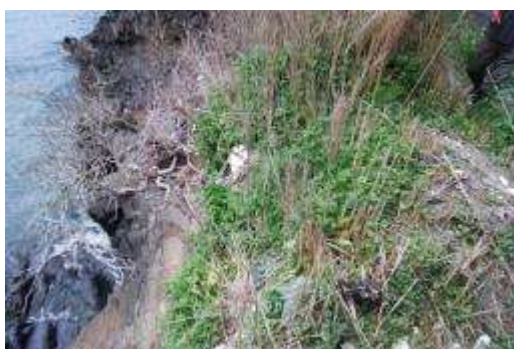
ツルナとハマヒルガオ