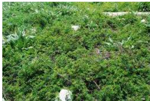
テリハノイバラ群落