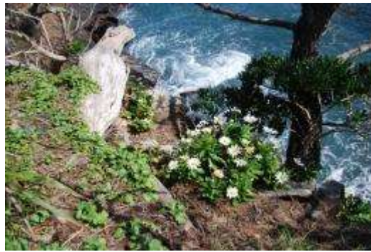
コハマギクとハマギク