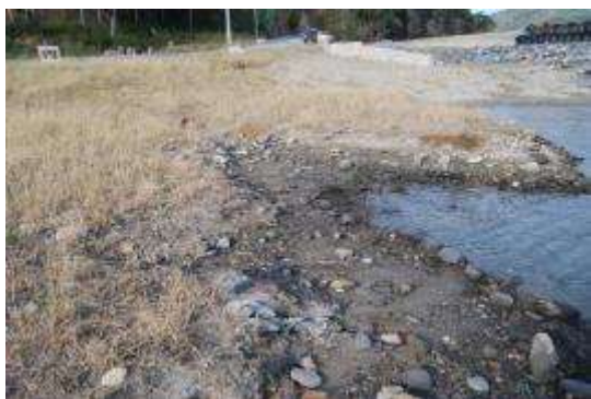
礫の多い後背湿地