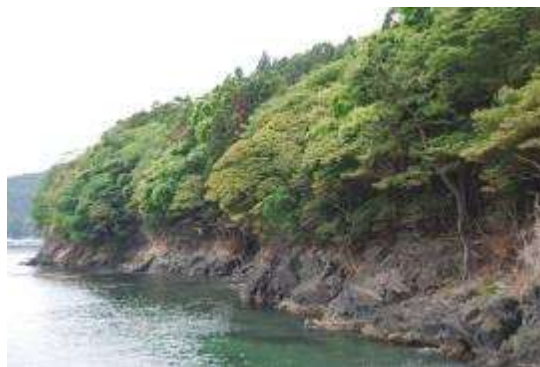
タブノキ・ケヤキ群落

浜の東側の急斜面にはクマノミズキ、タブノキを混生するケヤキ群落がある。亜高木層ではタブノキが優占するケヤキ・タブノキ群落である。林床に津波の影響がみられ、出現種数は少なく、低木層にヤブツバキ、イヌガヤ、ムラサキシキブ草本層にはケヤキの芽生えが見られるだけであった。調査資料 ②