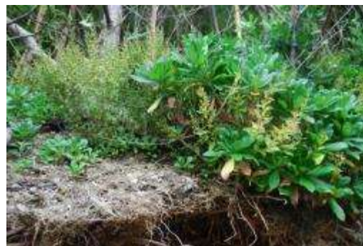
西の崎先端部・ハマギク・ハマボス