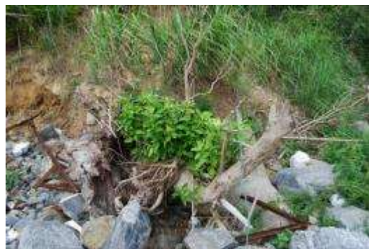
津波に洗われた崖と上部のタブノキ群落