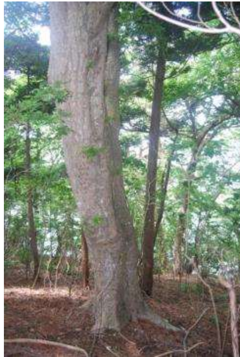
草本が育っていない林床