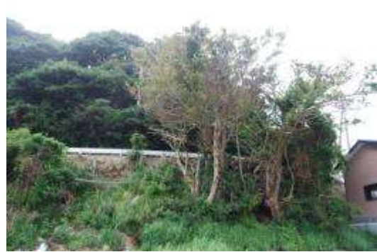
西：立枯れのタブノキ