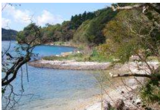
漁港から灯台への海岸線