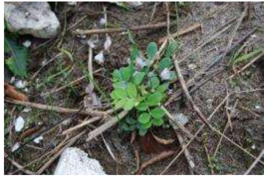
瓦礫より陸側：ハマエンドウ