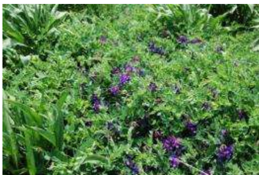
ハマエンドウ群落