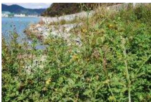
コセンダングサ群落 (漁港北側)