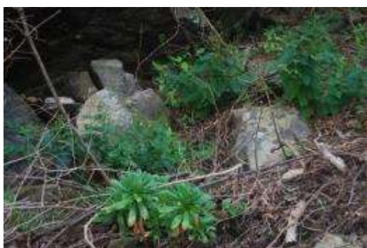
ハマギクとハマヒナノウスツボ