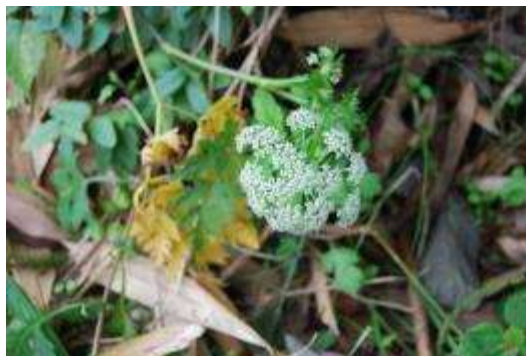
カラフトニンジン