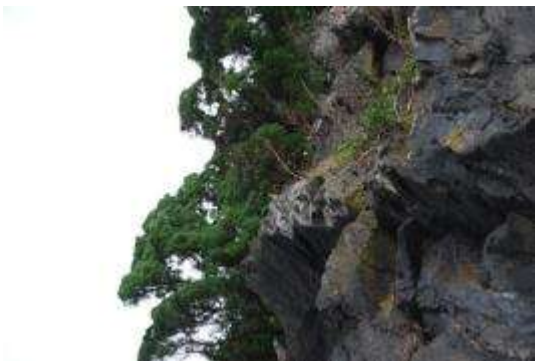
ハマハイビヤクシン、アオノイワレンゲ