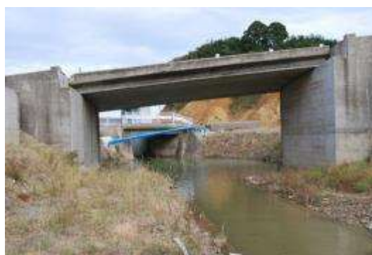
道路にかかっていた橋