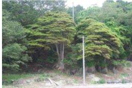
漁港後背地のケヤキ・タブノキ群落