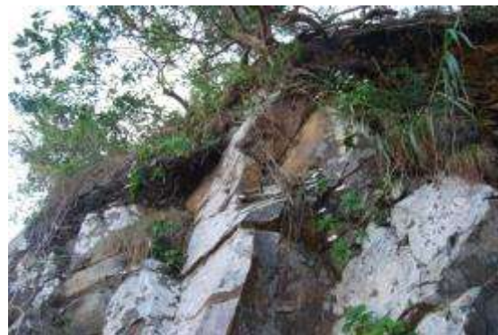
南側の崖上のハマギク