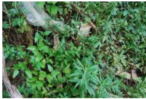
ハマヒナノウスツボ