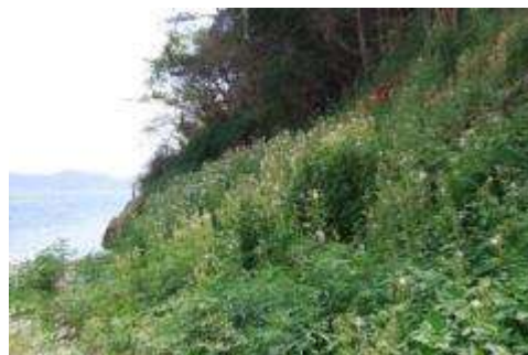
西：ベニバナボロギク