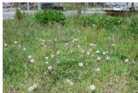
ハマヒルガオ群落