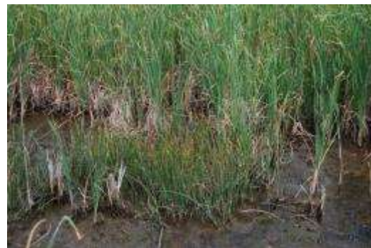
ヒメガマ・サンカクイ