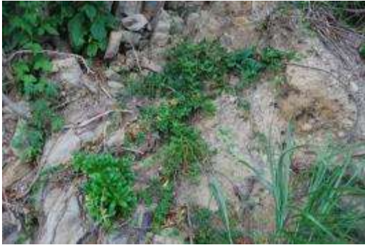
ハマギクとテリハノイバラ