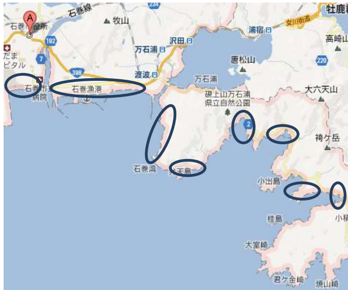
石巻地区の植物調査地位置図