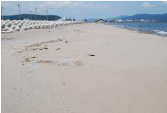
砂浜：東河口側・植生なし