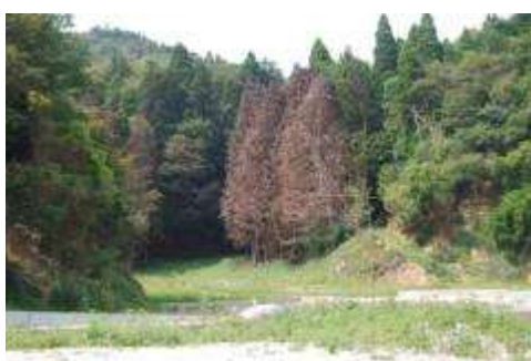
後背地：枯れたスギ