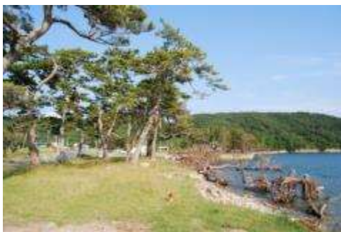
津波による倒木と生き残りのクロマツ

防潮壁の陸側のクロマツ林は、林齢の異なる群落の集まりで、それぞれの群落が間隔を保ち、また林齢の高い部分では樹木間距離があって、林床が明るくなる構造になっている。加えて、訪れる人々によって踏み固められるためか、人が入りやすくするために手入れをしてきたせいも、クロマツ以外の樹木が全く見られず、一部に実生の若木が見られるが林床のほとんどは丈の低い草本植物だけになっている。クロマツの実生が出来るのも環境が明るいからと考えられよう。