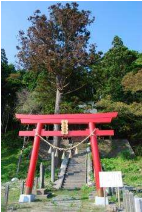
白山神社と枯れたスギ