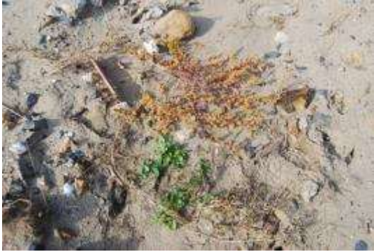
オカヒジキとハマヒルガオ