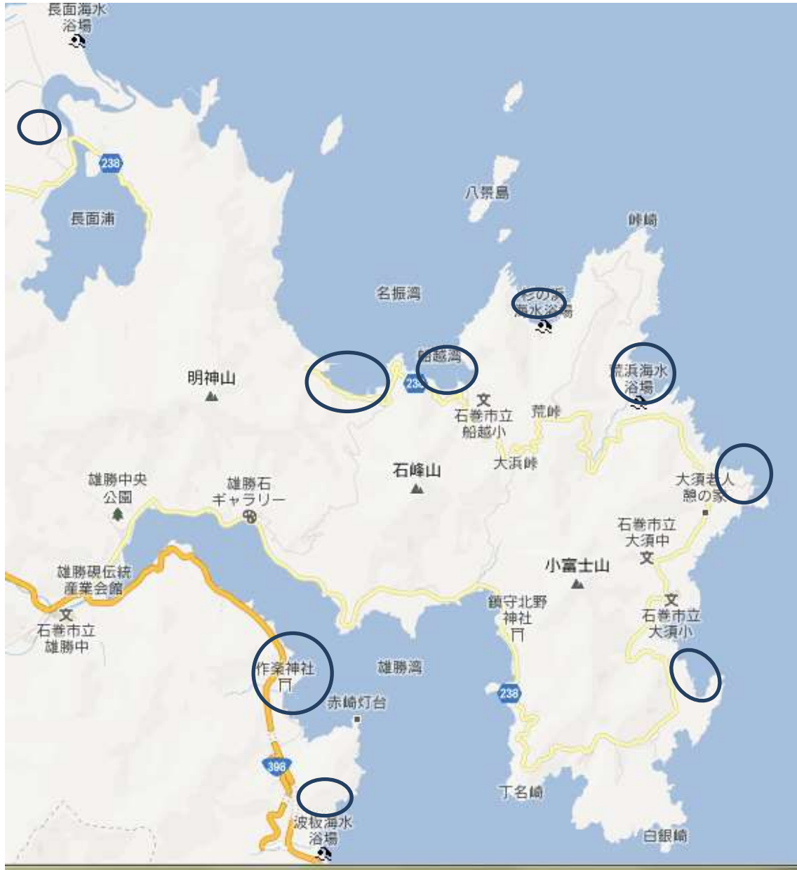
雄勝・河北地区の植物調査位置地