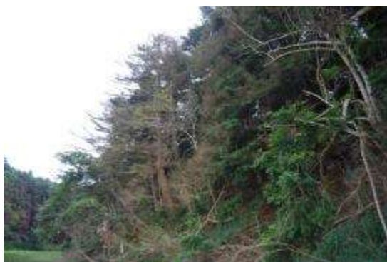
防潮壁の陸側のモミの立枯れ