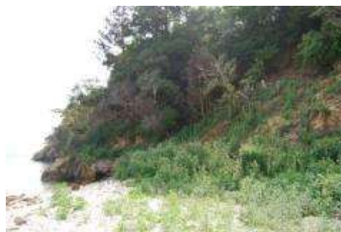
西の崎：枯れたスギ、クロマツ

浜の西端、津波の影響を受けて崩壊した崖地の上部にはオオシマザクラ、ヤブツバキ、ヒサカキの生育が見られたが、ここでも下部には大型の外来植物が繁茂していて、海岸植物は確認されなかった。