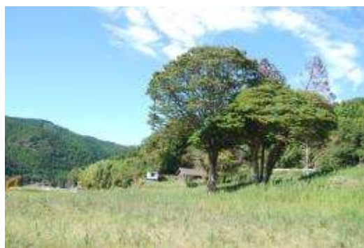
ケヤキ・タブノキ・スギ(枯)