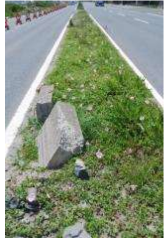
道路の中央分離帯の海浜植物