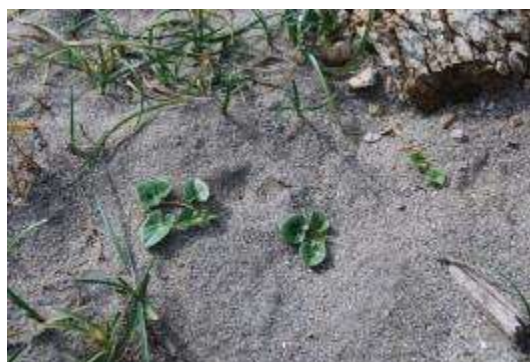
砂地のハマヒルガオとコウボウシバ