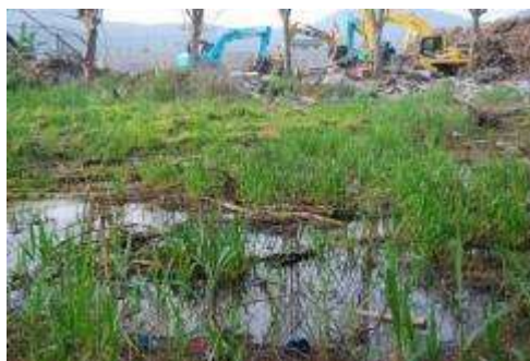
後背湿地（ヨシ・ミクリ）