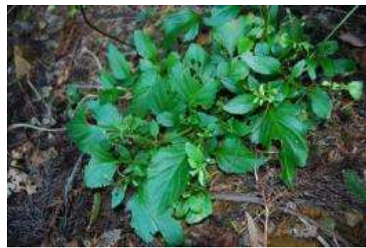
崖上のハマヒナノウスツボ