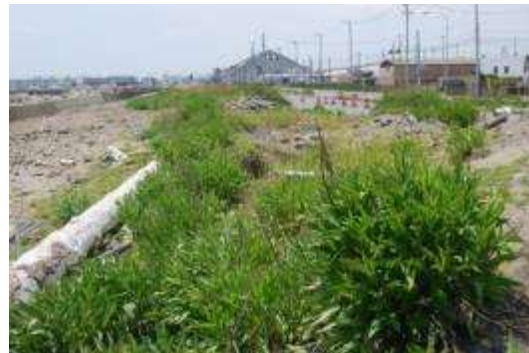
防潮壁と道路との間の空地：植生あり

海岸の砂浜には植生は全くみられない。防潮壁と海岸道路との間に巾 10mほどの砂や礫の堆積した空き地があり、海浜植物と外来植物が混生する植生が東西 200mほど続いている。