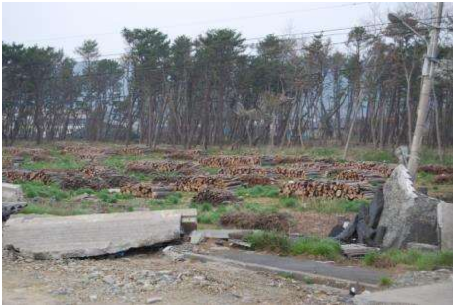
東南部の伐採処理されたクロマツ

大津波の影響で多くの倒木や枯損木ができ、その処理と瓦礫処理との関連による伐採で森林面積は大幅に減少した。立ち木の中にも被害木があり、今後も被害面積は増えるものと思われる。