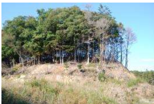
浜の中間にあるコナラ・モミ群落