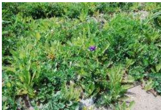
ハチジョウナ群落