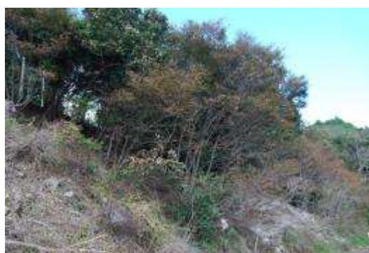
漁港後背地のケヤキ群落とカシワ群落