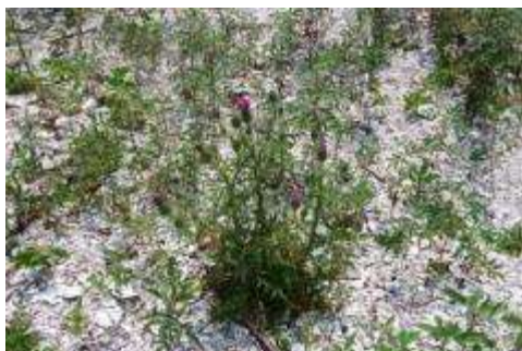
アメリカオニアザミ

地盤沈下と集落の流失により浜は空き地状態で、ベニバナボロギク、アメリカオニアザミ、コセンダングサ、セイタカアワダチソウなど大型の外来植物が目立つ植生となっている。海浜植物の生育は確認されなかった。浜の後背地では、沢筋のスギ植林地に立ち枯れ状態のものが数か所確認された。