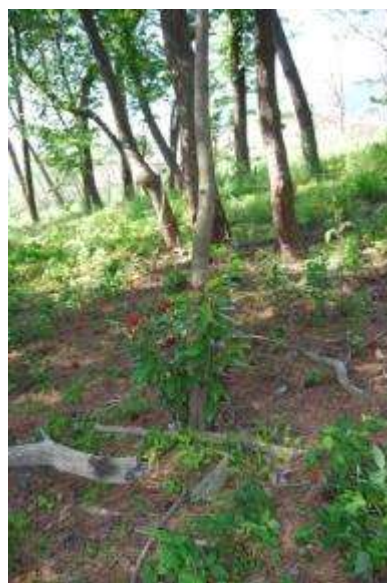
枯れたタブノキと根元の萌芽