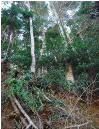
モミーヒサカキ群落