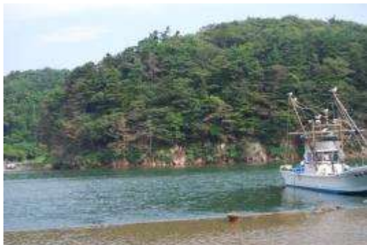
対岸からみた漁港東端部

ノキ、ヤブツバキ、ヒサカキの生育が観察された。モミは、海面から2 m～6 mくらいの高さに生えている径50 cmを超す大木を含む10株以上が立枯れ状態になっているのが観察された。