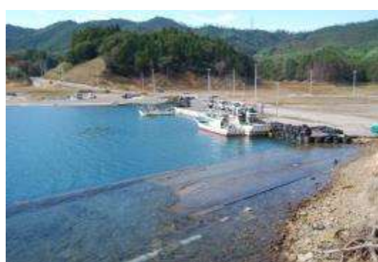
漁港：沈下した岸壁