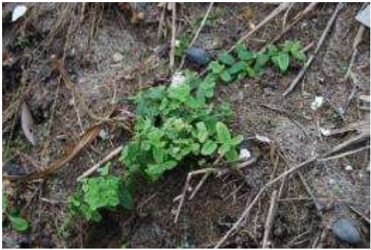
瓦礫より陸側：ナミキソウ