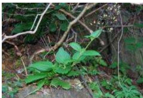
ハマヒナノウスツボ

北東側の崖上部ではケヤキ、タブノキ、下部ではカジイチゴ、マサキなどの低木とハマヒナノウスツボ、ハマアカザ、オニヤブソテツ、ラセイタソウ、アキカラマツ、ヒキオコシ、カワミドリ、ヤクシソウ、ヤマユリなどが観察された。