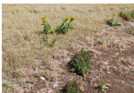
ホコガタアカザとトキワアワダチソウ