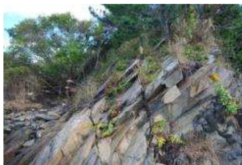
崖のトキワアワダチソウ