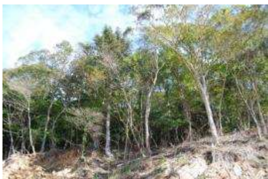
北側の植生：コナラ・イヌシデ・モミ