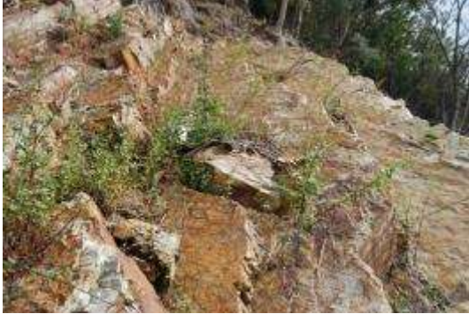
北側斜面崖地の植生：コセンダングサ