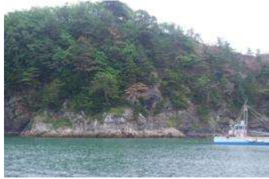
立枯れのクロマツ