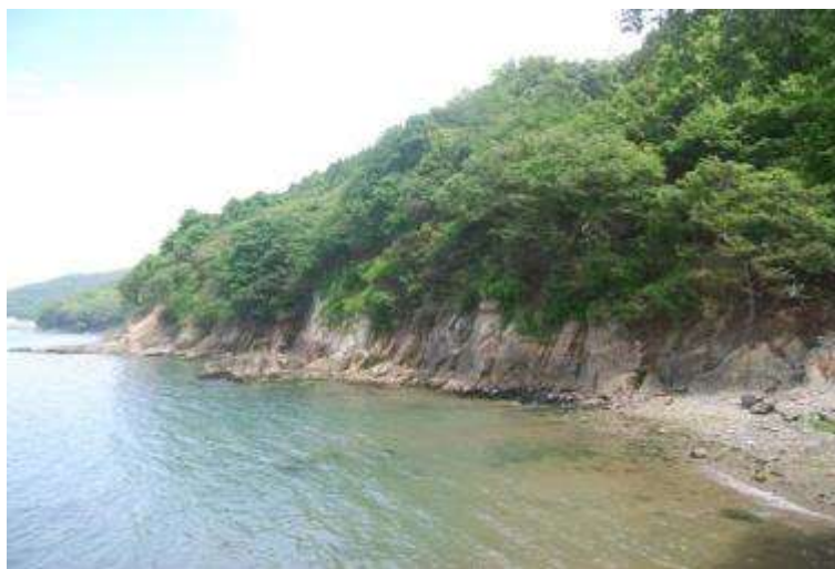
津波に洗われて植生の回復がみられない崖と礫浜

今回の調査では、津波に洗われ一部崩壊した崖と地盤沈下で小さくなった浜には、海岸性の植物はほとんど見られず、崖の上部に開花中のニッコウキスゲとトベラが観察されただけである。