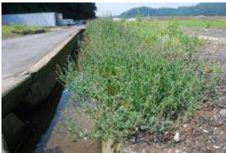
ホコガタアカザが混生するハマアカザ群落

群落を詳しく見ると、外来種のホコガタアカザが混生していることが分かった。これまで石巻地方では知られていなかったハマアカザと同じ属の植物である。