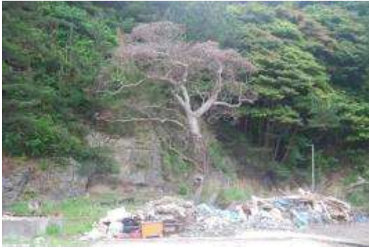
立枯れのタブノキ