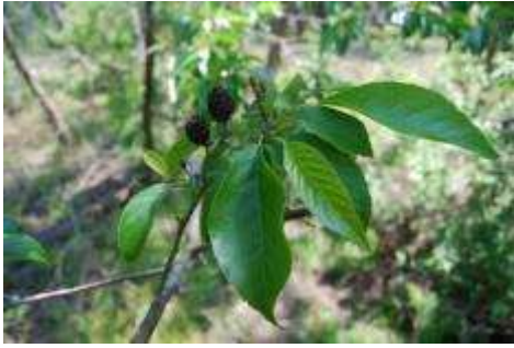
ケハンノキ花序と実