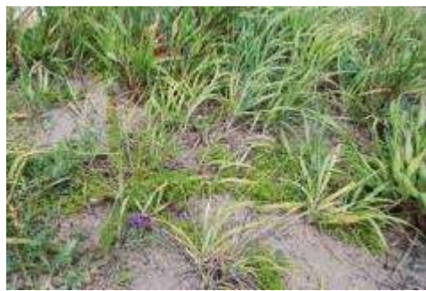
テリハノイバラ群落