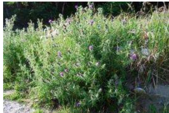
空地のアメリカオニアザミ群落