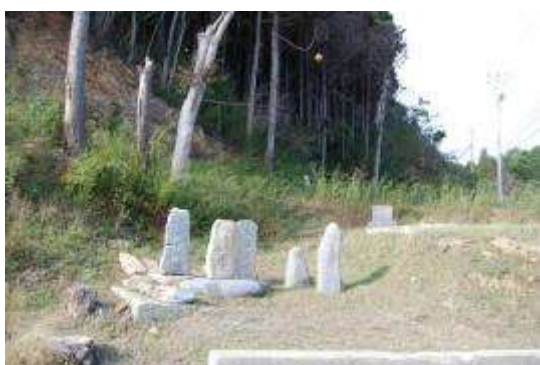
浜北端の石碑群と木に下がるウキ