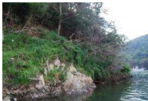
津波に洗われ、沈下した崖地