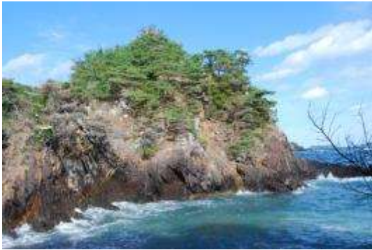
岬のアカマツ・クロマツ群落