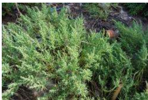
ハママツナ群落 (10月)