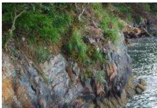
南側の海岸・崖地