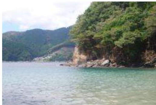
北側の南斜面：向かいは折浜