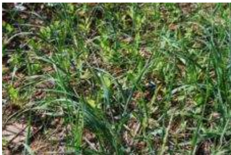
ハチジョウナとコウボウシバ

生き残りと思われる海岸植物は、本来の生育地ではない防潮壁の陸側で観察された。海面から1～2m高い環境のクロマツ林床と林縁で、ハマニンイク、コウボウシバ、ギョウギシバ、ハマボッス、マルバトウキ、ハマゼリ、ハマヒルガオ、ツルナ、ママコノシリヌグイ、テリハノイバラ、シオクグが観察された。