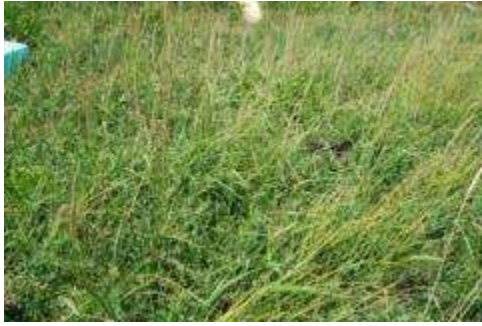
ハマニンニク群落