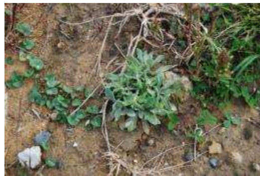
ハマヒルガオとアキノハハコグサ