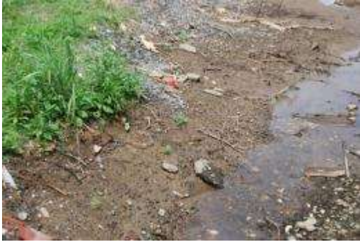
水たまり：ハマツナの幼苗