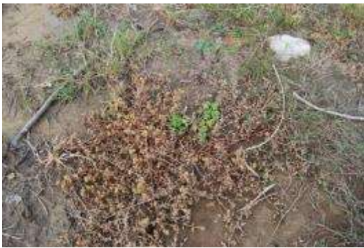
オカヒジキとツルナ