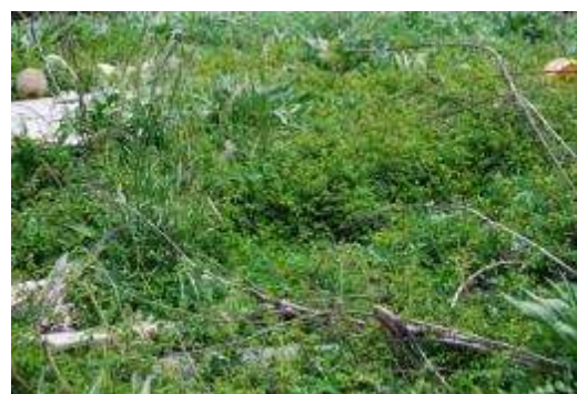
ハマニンニク群落