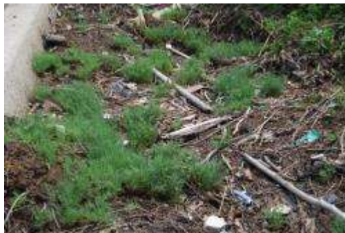
ハママツナ群落 (8月)