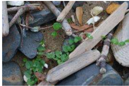
瓦礫の中のハマヒルガオ