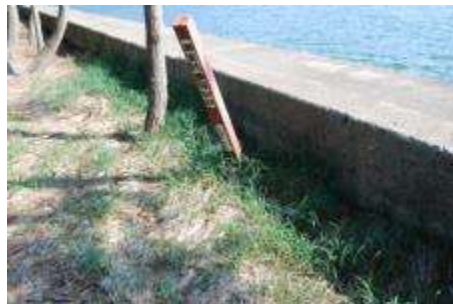
コウボウシバ群落