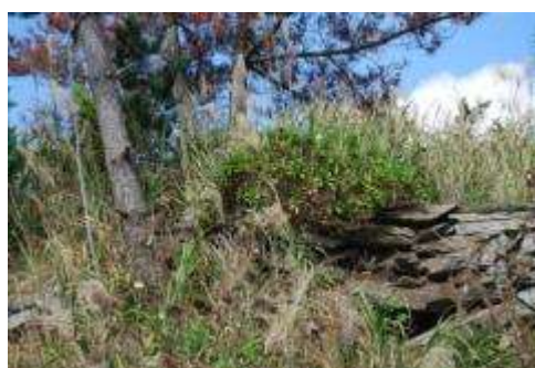
陸側上部のハマギク