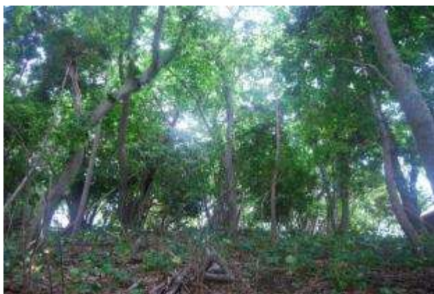
シカの不食植物マルバダケブキが増えている林床

林の海側には津波が押し寄せたと思われるが、その影響と思われるのは林床のクロマツが1株立枯れ状態になっていることぐらいである。ニホンシカの食害がより深刻な影響を及ぼしていると考えられる。