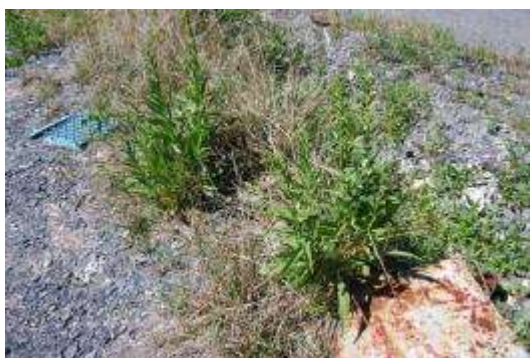
トキワアワダチソウ