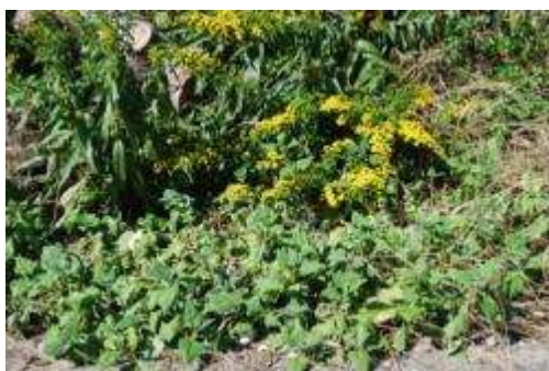
ツルナとトキワアワダチソウ