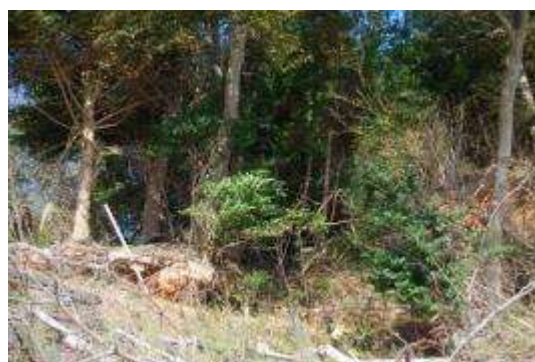
北端のイヌシデ・モミ群落