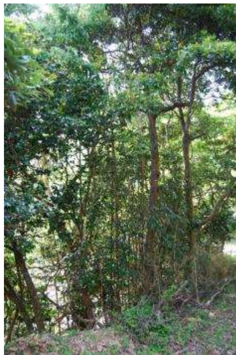
ケヤキ・タブノキ群落