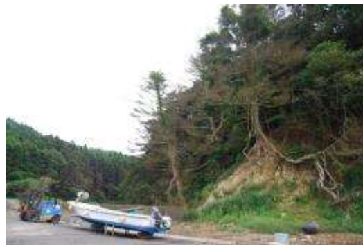
漁港東端部・枯れたモミ