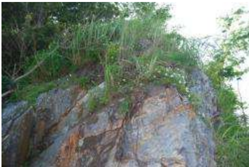
崖上のキリンソウ・テリハノイバラ

北向きの急傾斜地では上部にアカマツ、ススキが生え、下部にはスカシユリ、キリンソウ、テリハノイバラ、コハマギク、オオウシノケグサ、ヤクシソウが確認された。