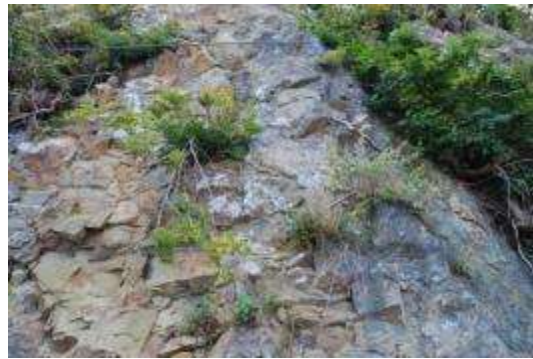
キハギ・アキノキリンソウ