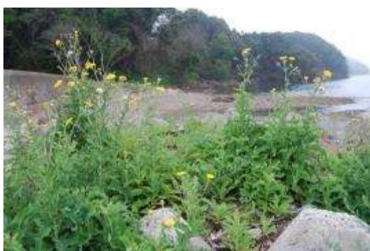
テトラポット上のハチジョウウナ