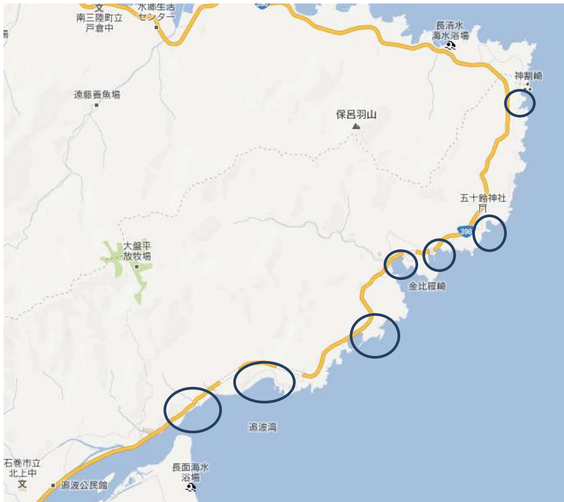
北上地区の植物調査位置地地図