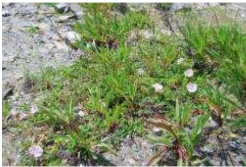
ハマヒルガオとトキワアワダチソウ