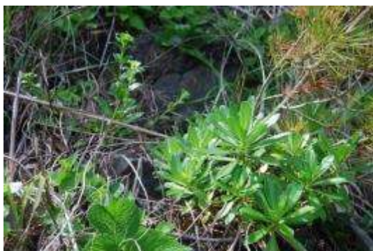
ハマナデシコ・ハマギク