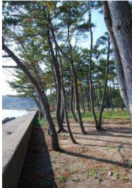
生き残ったクロマツ林の林床

林齢の若い胸高直径20cm前後、高さ約8mのクロマツ群落の林床で観察された植物は、在来種のハマニンニク、ハマゼリ、ハマボッス、ツメクサ、テリハノイバラ、ハマギク、ハチジョウナ、ススキ、ヨシと外来種のアメリカセンダングサ、ノボロギク、ベニバナボロギク、コセンダングサであった。