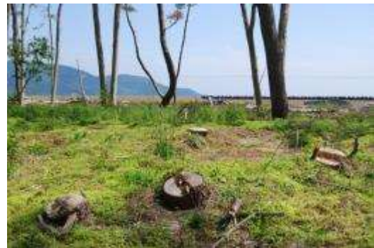
切り株のあるクロマツ林内

海岸林を構成する樹種はクロマツ（アイグロマツ）で、低い砂丘上に植林されている。陸側には後背湿地がありガマ、ショウブ、イネ科植物、タデ科植物などで構成されている湿生植物群落があり、その周辺には小規模なケハンノキ群落が存在する。海側のクロマツ