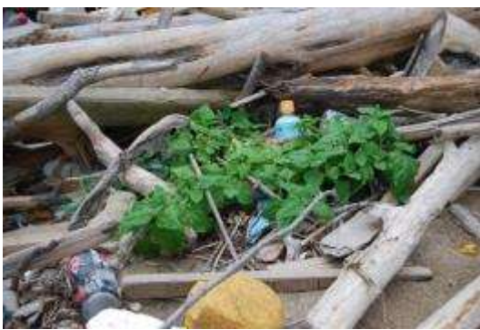
瓦礫の中のツルナ