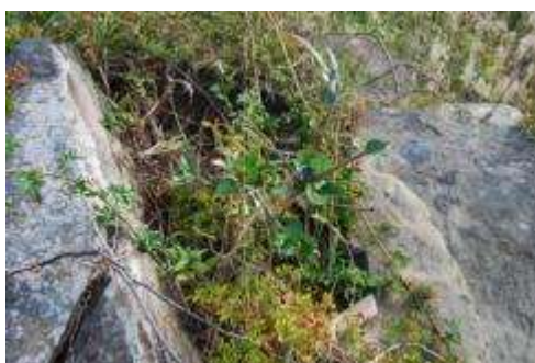
シャリンバイとテリハノイバラ（海側）