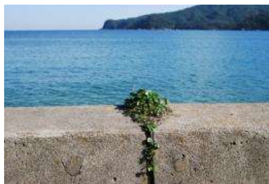
ハマニンニク・・・・・・防潮堤の割れ目に生育する・・・・ハマヒルガオ