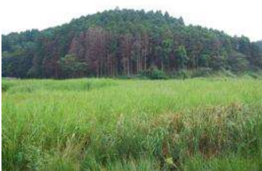
後背湿地とスギの立枯れ