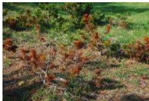
枯れた実生の若木

林齢の高い胸高直径65cm前後、高さ約12mのクロマツ群落の林床で観察されたのは草丈の低い植物だけであった。