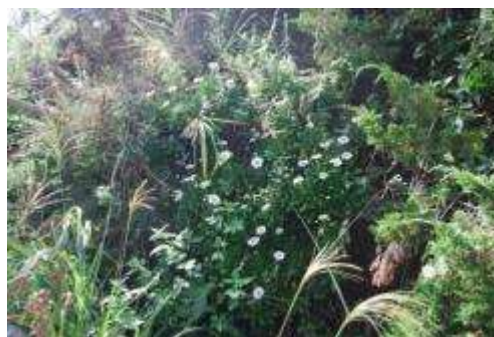
ハマギク（陸側下部）