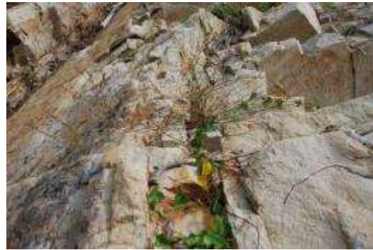
アキノミチヤナギとアオツツラフジ