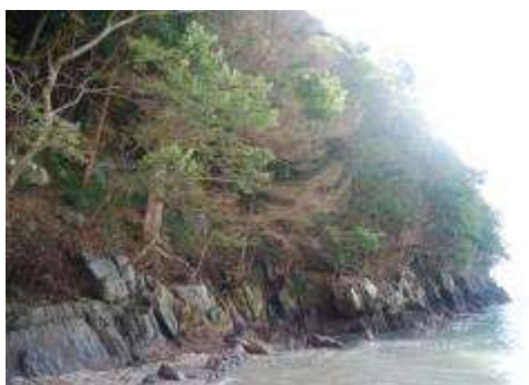
南側の北斜面：枯れたモミ