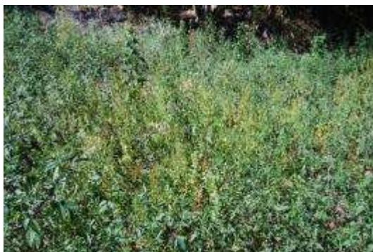
ケアリタソウ・コセンダングサ群落

漁港西端から萩浜灯台のある崎までの植生は、海岸の道沿いにケヤキ、クマノミズキ、コナラ、カスミザクラ、カシワ、アカマツなど生え、その間にコナラ、イヌシデ、ケヤキが優占する小林分がみられる。道の山側はスギ植林地が多く、上部ではモミが多い。