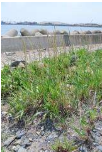
ハマニンニクとトキワアワダチソウ