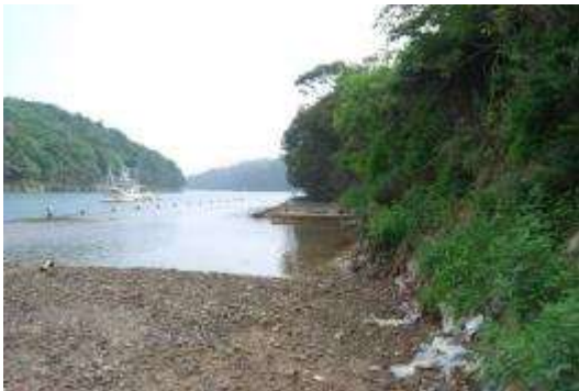
沈下した西側岸壁

西側は海面から3～4 m上に道路があり、海面と道路との間が崖地になっている。道路の上はタブノキ林になっている。崖地の上部に立枯れ状態と半枯れ状態のタブノキ2株とマサキが観察されたが、在来種ではヨモギ、カワミドリ、ギシギシ、外来種ではホコガタアカザ、コセンダングサが見られた。