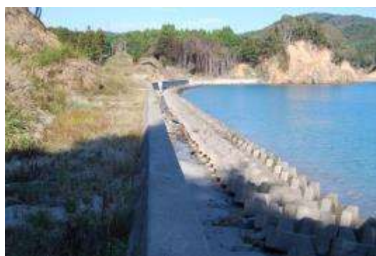
防潮堤とテトラポット