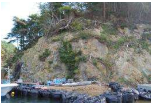
南側斜面崖地の植生：