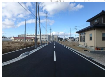
[区画道路舗装完了]