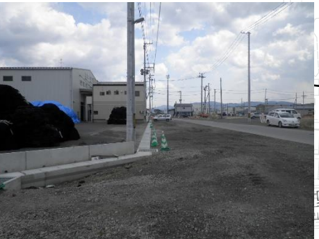
道路側溝敷設状況