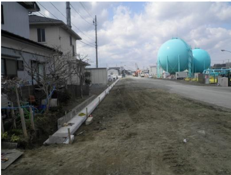
道路側溝敷設状況