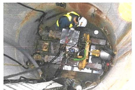
▲下水道管推進工事状況