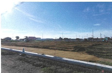
▲宅地整地工事状況