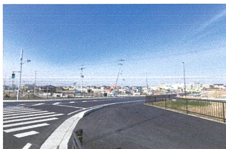
▲取付道路完成状況