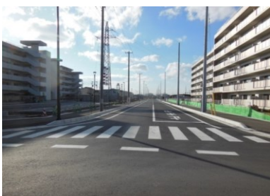
▲（都）釜大街道線道路状況（終点側）