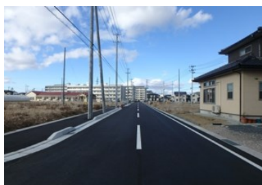
▲地区南側 区画道路築造状況