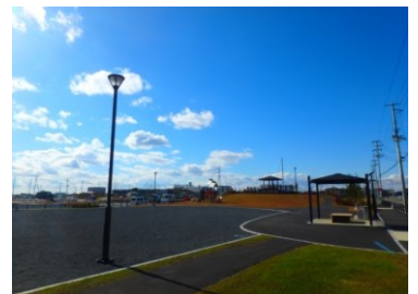
▲地区南側 公園築造状況