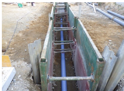
▲ 污水管渠布設状況