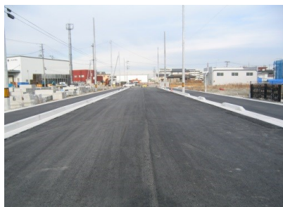
▲ 道路舗装敷設状況