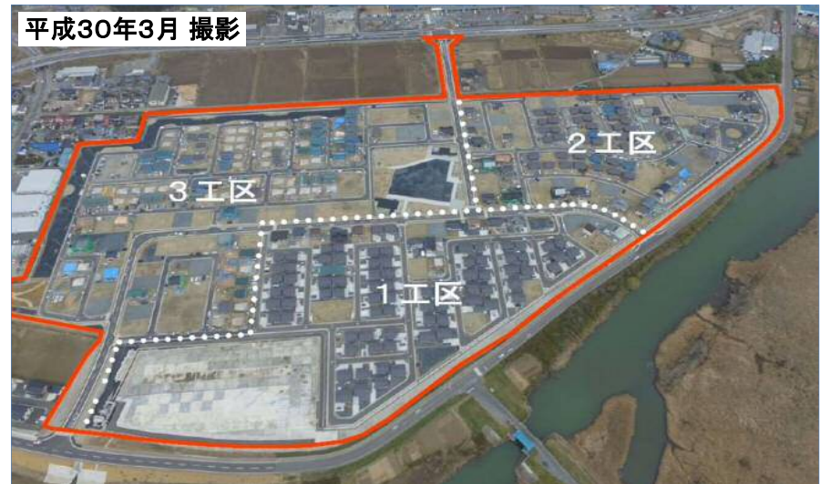
【工事進捗状況】平成30年3月末現在