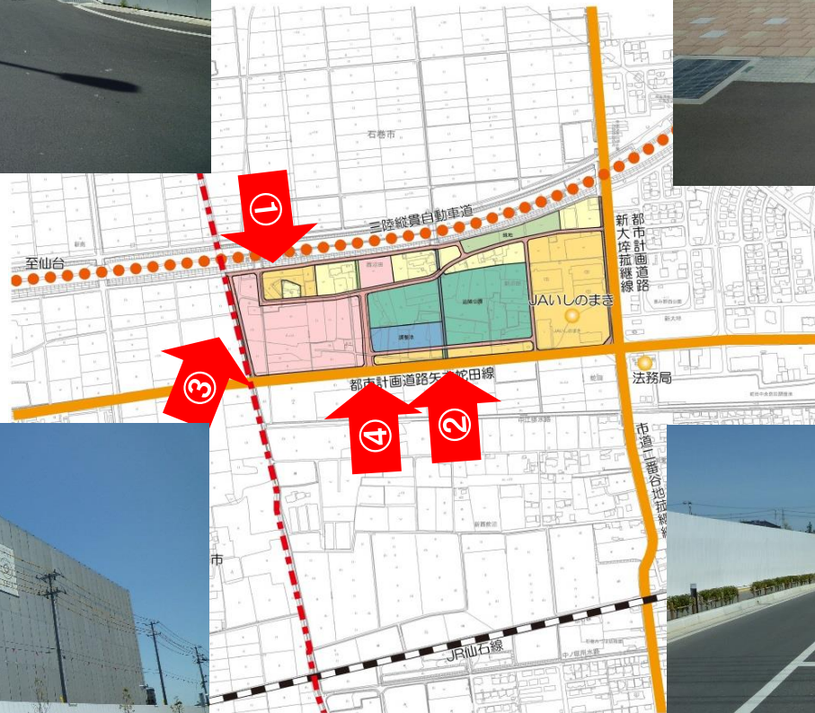
写真③ (H29. 4撮影)