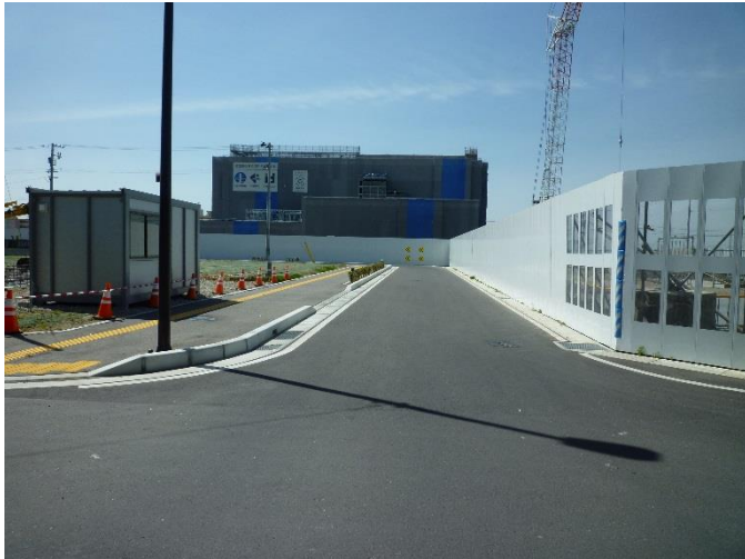
写真① (H29. 4撮影)